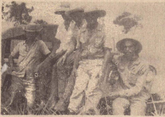
Os trabalhadores rurais — os bóias frias — são, há muito, as vítimas do salário mínimo

J.G. QUIRINO Correspondente REGENTE FELJÓ