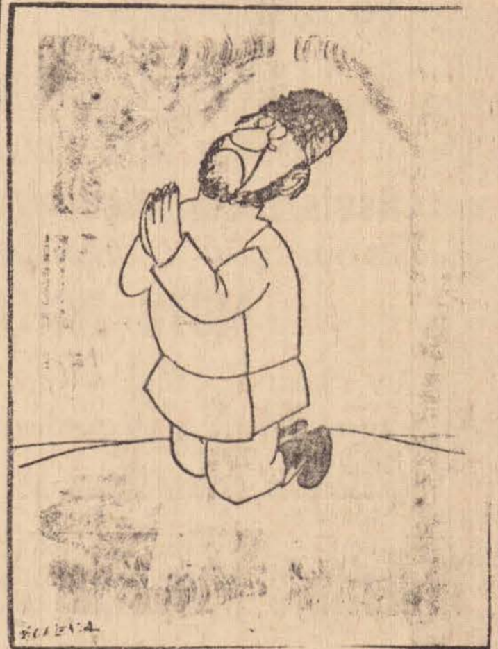
O PREFEITO IMPLORANDO A SÃO PEDRO PARA NÃO CAIR CHUVAS

Dois capiras estavam nas proximidades da Estação Ferroviária, quando um disse para o outro: — Compre, acho que hoje vai chover. Olha o céu está preto. — Que nada comprade, são as Andorinhas. O pior é o «bombardeio» de «granizo» daqui a pouco.