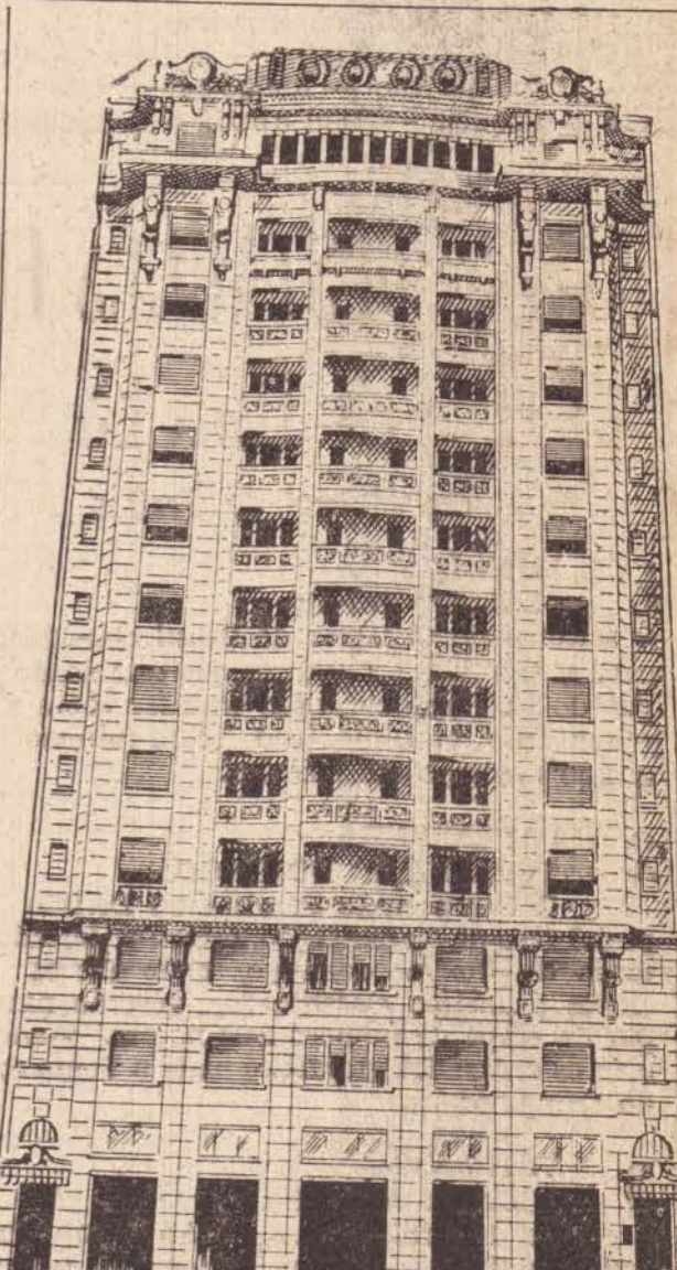
São Paulo - LUX HOTEL PRAÇA JULIO MESQUITA, 34