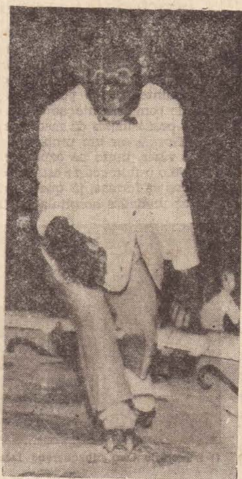
Macaco gorila de 1.50 de altura e pesa 85 kg.

MACACO GORILA UM ANIMAL DE FORÇA TREMENDA E UMA INTELIGENCIA QUASE HUMANA