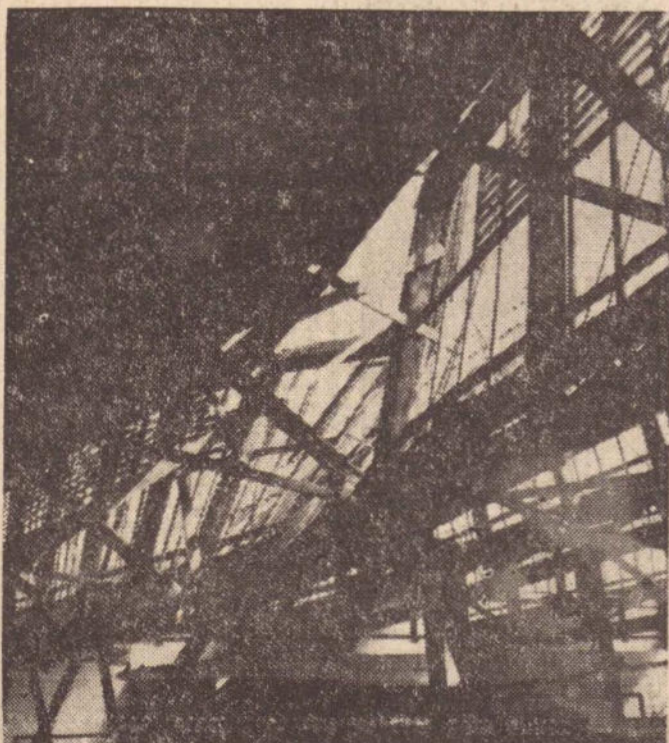
Algumas ripas foram pregadas no teto para evitar a sua queda.