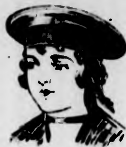
Barrelli alla marinara

Di cotone bianco 18000 Di casemira 59200