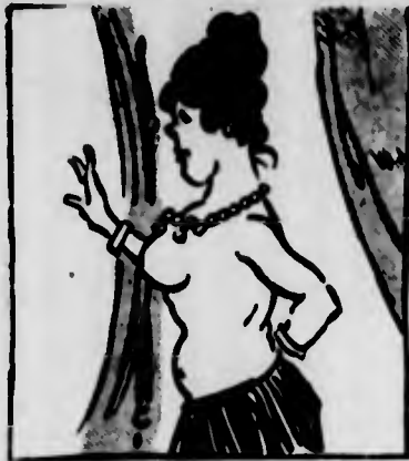
Prove di décolleté regale