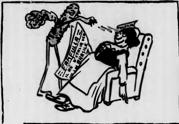
II. TORSOLO: — Su! Se stieni al semplice annunzio stiano freschi!