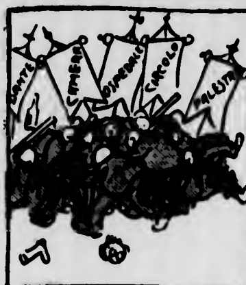
L'imminente gara per la su- premia nei ricicimenti