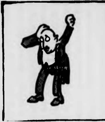
IL CONSOLE: — Povero me! Son fritto. La colonia mi farà impazzire!