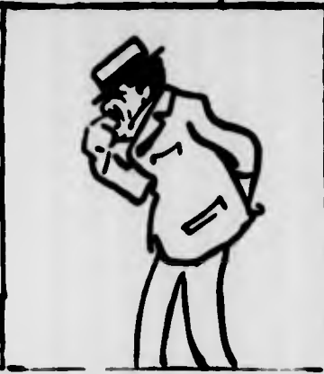
FRONTINI: — Maledizione! Non potevano dirlo prima che ritirassi la mia candidatura al Circolo?