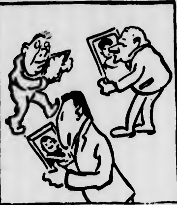
POCI: — Presto, presto, i ritratti di tutta casa Savoia alla parete. Se l'ittorio viene a visitarci...