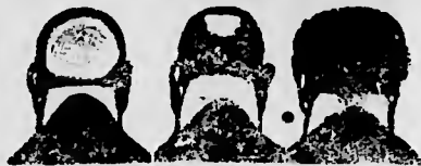
Distruzione della forfora

Se già quasi non si ha capelli, il "PILOGENIO" fa nascere capelli nuovi e abbondanti. — Se si incomincia ad averne pochi, il "PILOGENIO" impedisce che i capelli continuino a cadere. — Se si hanno molti capelli, il "PILOGENIO" serve per l'igiene dei capelli stessi. Per il trattamento della barba o lozione di toaletta