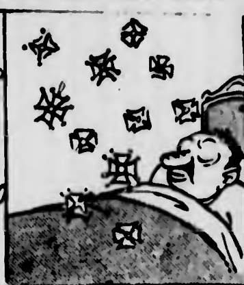
Il sogno dorato provocato dal- l'annuncio

Molti italiani hanno fin d'ora messa fuori la bandiera, giurando di non levarla se non quando Re Vittorio sarà ripartito per l'Italia.