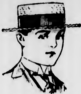
Cappelli di paglia