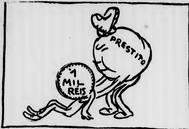
IL PRESTITO al CAMBIO: — Non so capire perché neanche col mio aiuto riesca a rialzarti...