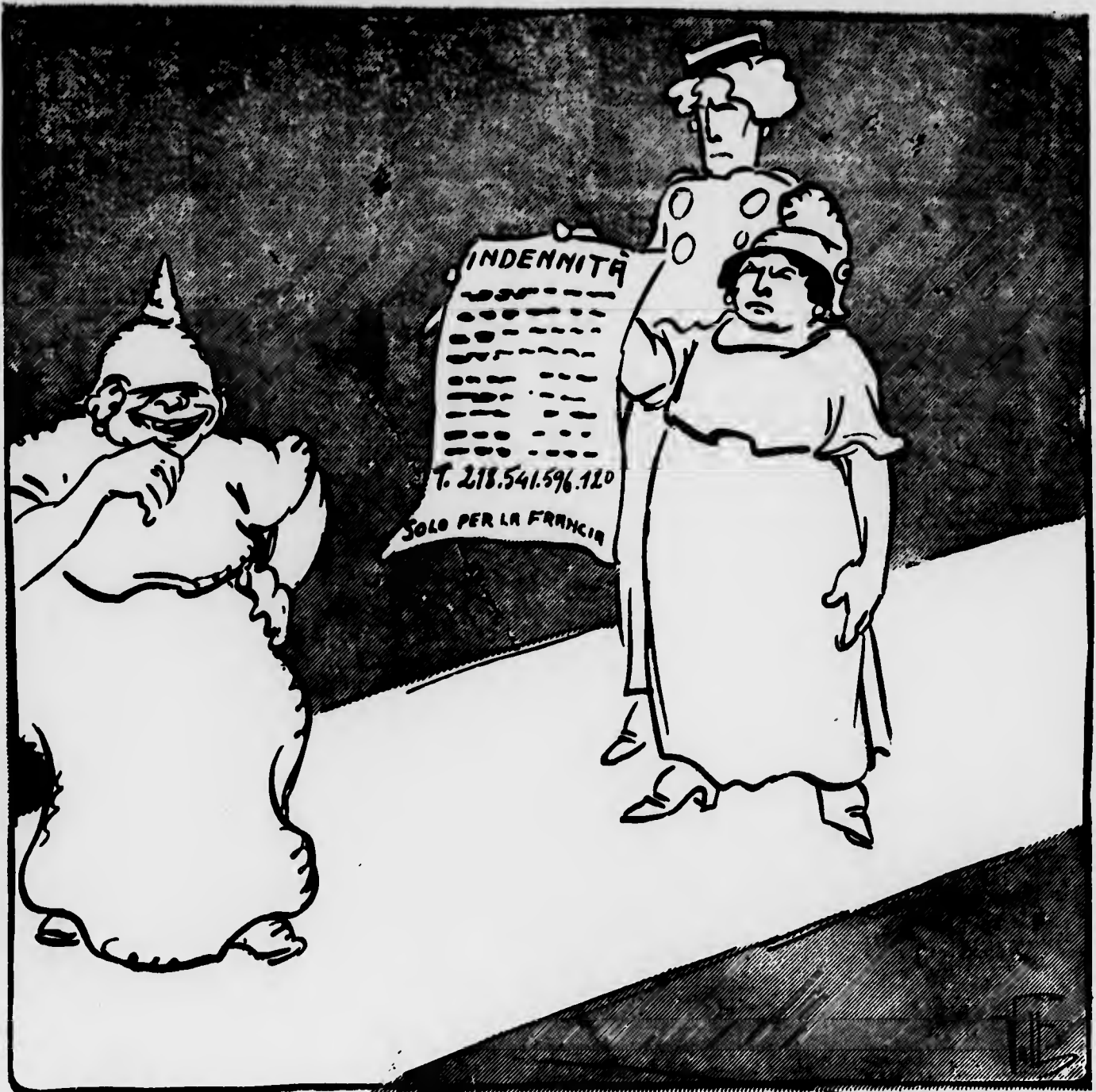
LA GERMANIA — Il conto torna, non c'è dubbio! Tutto sta a vedere chi lo pagherà.