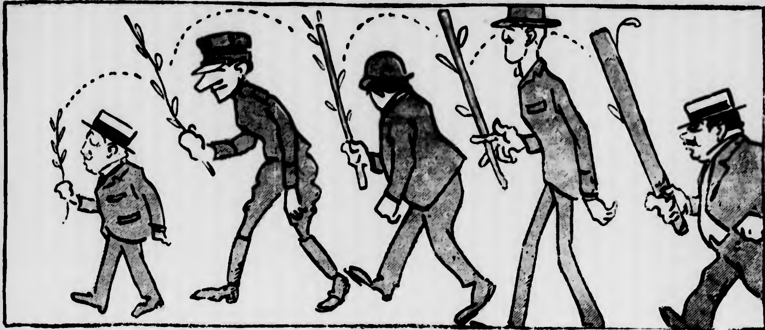
BARELLA: — Arrazzato a questo ramo d'ulivo che mi ha tutte le arie di una solcaia... legaturo.

e la colonia dato l'affidamento pieno, assoluto che offrono gli uomini che reggono le sorti continuerà ad appoggiarla. Qualuno ha suggerito al Palestra di mettersi alla testa della iniziativa per la costruzione della Casa degli Italiani , ma il consiglio per quanto vuole andare... adante con juicio , e cercherà prima di condurre a termine l'impresa dello stadium che non è piccola né facile. Troppa carne al fuoco può riuscire pericolosa e noi siamo lieti di sapere che il nuovo consiglio non si è lasciato affatto sedurre... per quanto dalla... mania di grandezza. Alla Casa degli Italiani può benissimo pensare qualche altra istituzione.