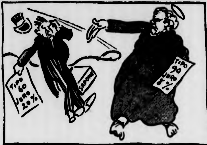
Uno schiaffo solenne agli strozzini nordamericani