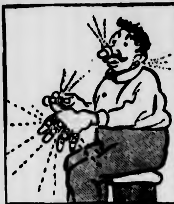
IL GRAUDO: — Il Re deve vedere che abbiamo saputo fare i soldi.