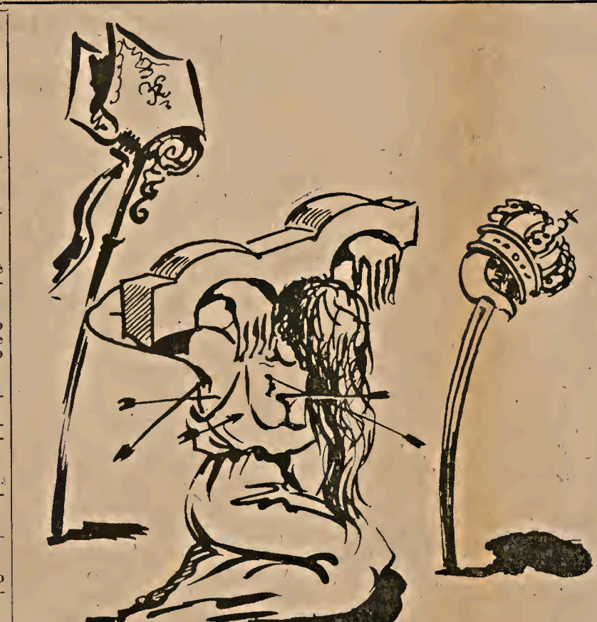
LAS PLAGAS QUE ASOLAN EL PUEBLO ESPAÑOL

Comprendo que en una sociedad de mentira no exista un solo revolucionario. — Z.