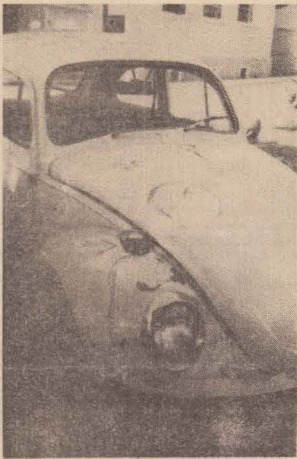
O veículo atropelante e os pontos de impacto circundados.