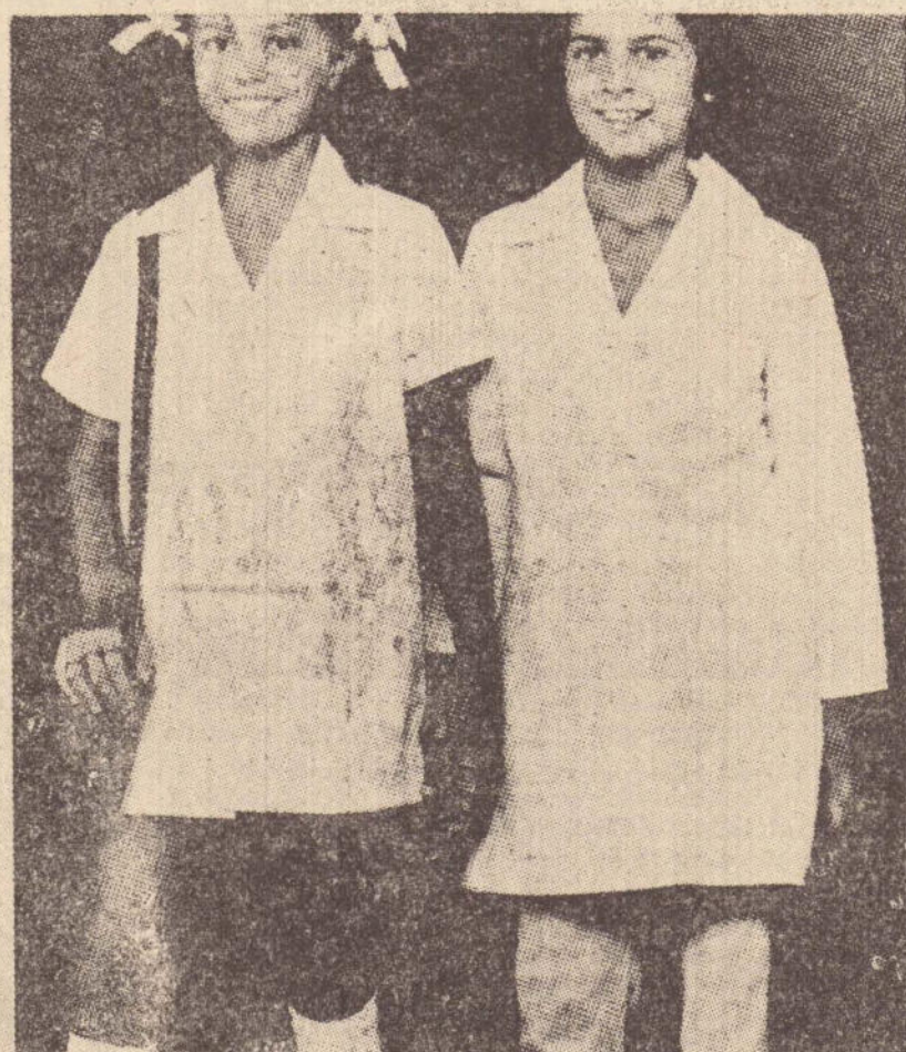
Avental unissex em tergal, manga longa e manga curta. Modelo oficial, 6 a 18 anos.