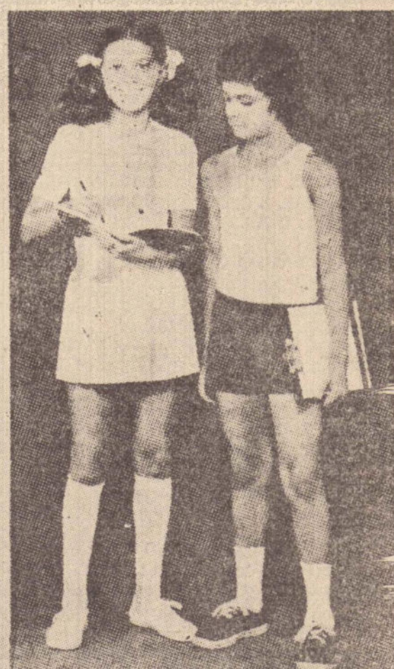
Camiseta em malha de algodão canelada, 6 a 16 anos.