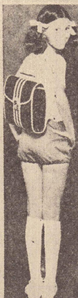
Mochila escolar Kelson's, várias cores