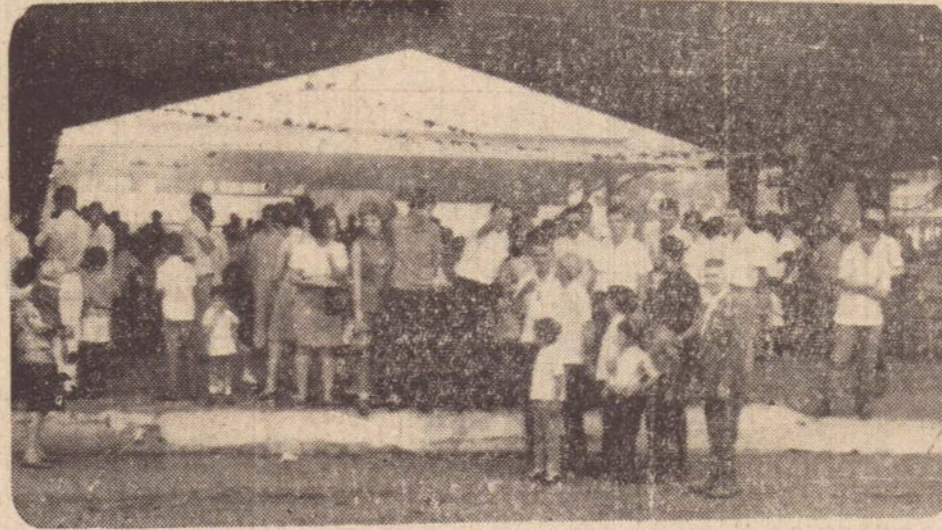
Um aspecto da reunião.

Com o contrato renovado, Didi apresentará até o final do mês uma lista de 18 jogadores — os únicos que terá o clube — aos dirigentes do River Plate.