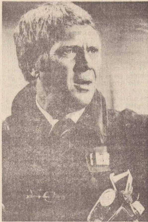
Steve McQueen aparecerá envelhecido para seu próximo papel no filme "O inimigo do povo", dirigido por Arthur Miller

Os cabelos cheios, a barba espessa e a feição envelhecida: assim aparecerá em seu próximo filme Steve McQueen, o caçador de primas de "Em nome da Lei", o intratável policial de "Bullitt", o intrépido bombeiro de "A Torre do Inferno". "Atualmente, estou preparando-me para o papel que interpretarei em um filme adaptado por Arthur Miller, da obra de Ibsen "Um inimigo do povo" explica o ator.