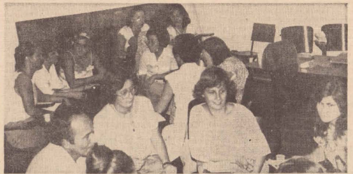
Um aspecto dos trabalhos desenvolvidos pelas assistentes sociais.