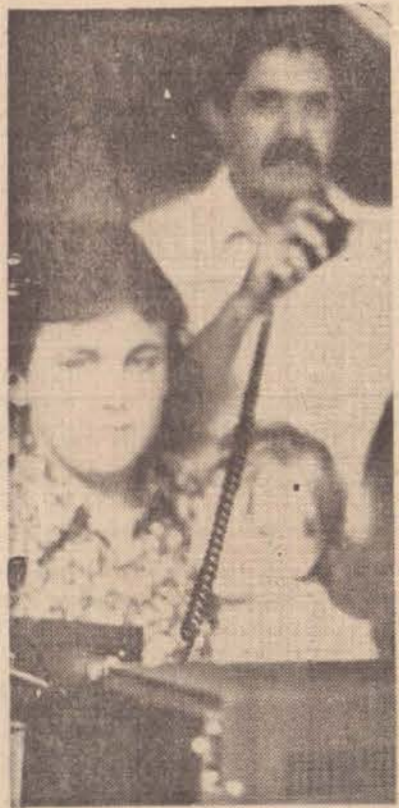
O PX-Faixa do Cidadão aproxima várias gerações e chega a Presidente Prudente