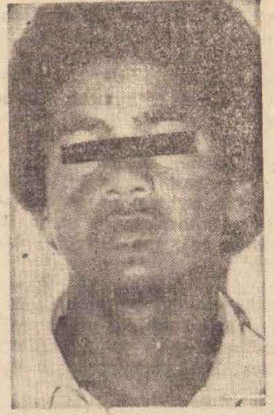
R. G. S.