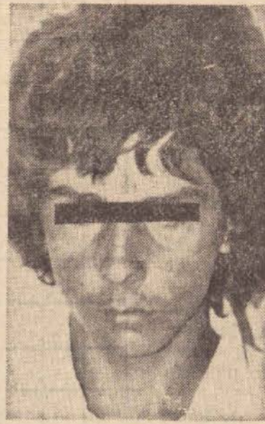
S. P. S.