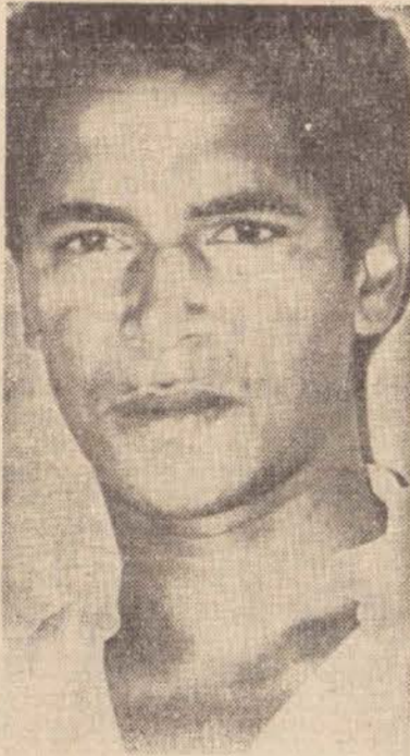
S. S. Amigo do Traficante