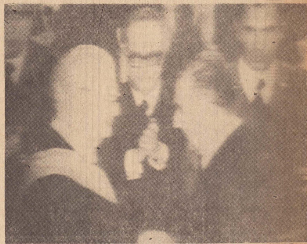
Na foto, momento em que o presidente Médici colocava a faixa presidencial, no Presidente Ernesto Geisel

Sorocabana, através da UMAS saudam o ilustre brasileiro ao ensejo da posse na presidência da República, formulando votos de feliz governo sequencia diretrizes traçadas visando a grandeza da Pátria, após a Revolução".