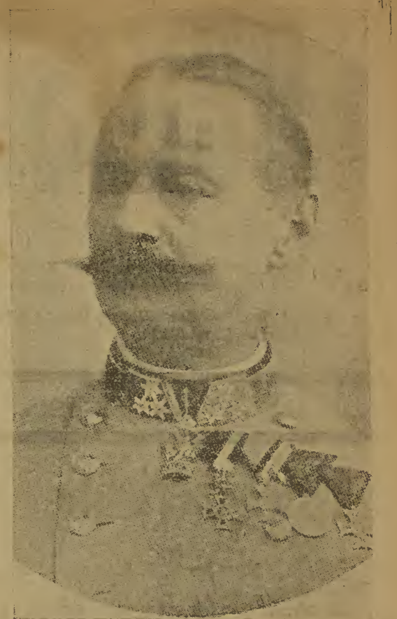
FZM Alexander Ritter v. Krobatin Oesterr.-ung. Kriegsminister

ren nach den hier eingelaufenen Telegrammen energisch gegen die Zerstörung dieses Wanders der göttlichen Kunst.