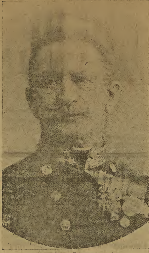
G. d. I. Franz Freiherr Conrad v. Hölzendorf Oesterr.-ung. Generalstabschef

London, 23. Alle Zeitungen fahren fort, energisch gegen das Bombardement und die Zerstörung der Kathedrale von Reims zu protestieren. Die Erklärung, die die deutsche Regierung gibt, indem sie sagt, daß das Feuer der Franzosen aus jener Richtung kam, hat noch mehr Entrüstung verursacht, da sie noch weniger wahr ist. Die Franzosen griffen die Deutschen nicht aus dem Innern der Stadt an, sondern aus der Umgebung und ließen Reims rechter Hand liegen. Die deutschen Artilleristen zielten mit Absicht nach der Kirche, um sie zu zerstören. Aus Paris wird berichtet, daß die Kirche in einen Schutthaufen verwandelt ist, da durch die deutschen Granaten ein Brand entstand. Von allen Kostbarkeiten, die in der Kirche vorhanden waren, wurden nur die historischen Teppiche mit der Geschichte des Lebens Jesu gerettet. Alles übrige wurde zerstört.