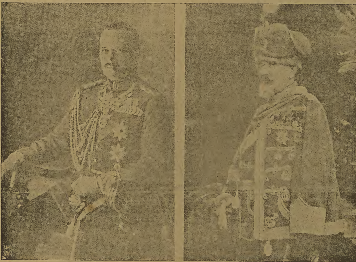
Grossherzog Ernst Ludwig von Hessen

Und welchen Eindruck muß der folgende Bericht in England gemacht haben, den der Londoner „Daily Chronicle“ von seinem Doulogner Korrespondenten erhielt? Die Schilderung stammt von einem englischen Soldaten und lautet: „Wir brachten fünf volle Tage in den Laufgräben zu und gingen abwechselnd vor und zu-