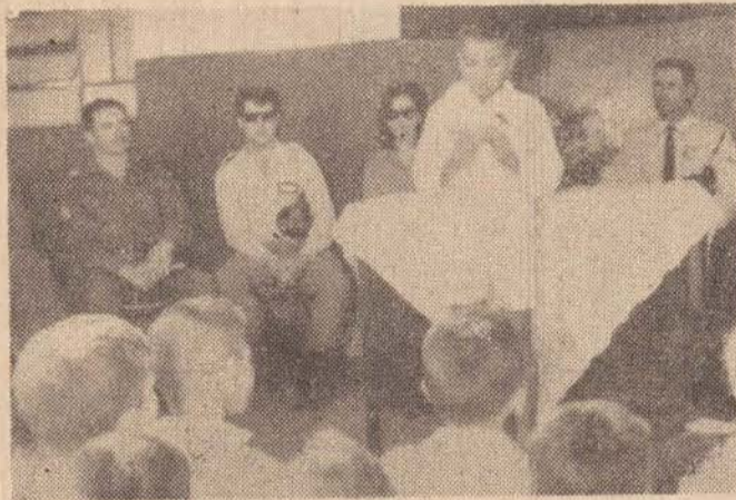
Um dos alunos discursou sobre o 7 de Setembro