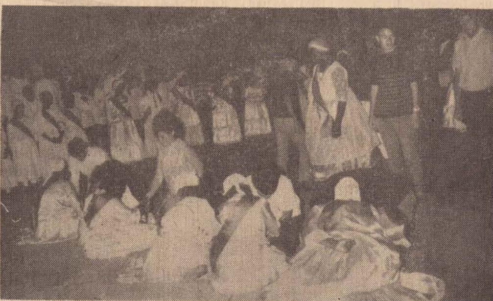
Neste flagrante, as Senhoras do grupo que segundo a Babá são do primeiro século, quando sentadas estavam atendendo consultas. Foi uma avalanche de pessoas que se dirigiram às senhoras contando seus casos. Foi necessário suspender as consultas, em virtude do adiantado da hora.

Por isso, esta carta é para registrar nossos sinceros agradecimentos e ao mesmo tempo renovar nossa crescente admiração pela verdadeira imprensa, à qual pertence o "O IMPARCIAL".