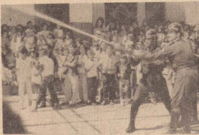
Demonstração dos bombeiros para extinção do fogo