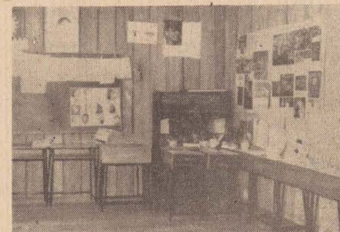
Exposição de trabalhos realizados pelos alunos do Centro Educacional 324 do SESI, realizados durante o mês de agosto.