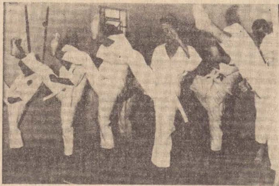
Flagrante colhido durante um treinamento da Academia de Karatê Wado Kai

A Academia de Karatê Wado Kai, localizada à Avenida Washington Luiz, 956, estará promovendo a partir do próximo dia 22, nos salões do recinto velho do Tenis Clube, uma sensacional demonstração de mestres de karatê.