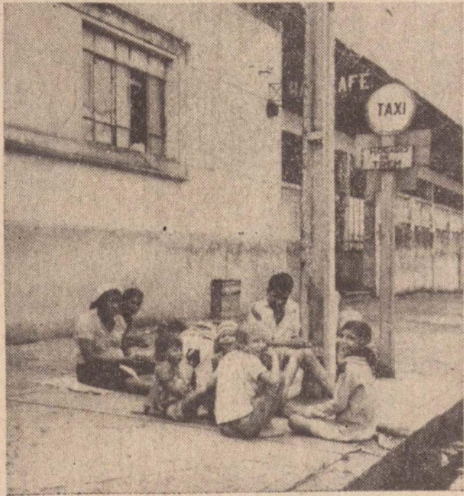
Entre os flagelados é sempre numerosa a prole. Ao relento eles ficam até que o chefe consiga um emprego ou retome a sua caminhada para o ignorado.

Estão transitando pela Alta Sorocabana, em direção ao Estado de Mato Grosso as correntes migratórias do Nordeste, fugindo das sêcas e à procura de novas frentes de trabalho. Nos últimos dias passaram por Pres. Prudente vários caminhões — os «pau de arara» — conduzindo centenas de famílias. Num só desses veículos encontravam-se 100 pessoas entre adultos e crianças. Elas procedem, na maior parte, de Poço Redondo e Feira Nova, no Estado de Sergipe, em direção à Glória de Dourados,