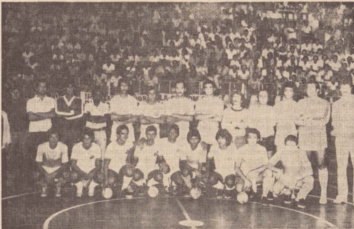
Equipes do IPEA e Ipanema Clube, campeã e vice da COPAMEPP.

Depois da Copamepp de Futebol de Salão, que por sinal foi sucesso, em que novamente nos Ginásio estará sendo utilizado para a prática do Futebol de Salão.