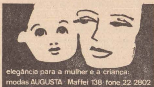
elegância para a mulher e a criança: modas AUGUSTA - Maffei 138 - fone 22 2802

• A Floricultura Vitoria Régia já está preparada para atendimento especialmente ao Dia das Mães — este ano 13 de maio, de modo que antes de comprar, se dirija à loja da rua Siqueira Campos 488, lembrando que também em matéria de decoração continua sendo a preferida na cidade e região, e até nos estados vizinhos E, a Floricultura Jardim, Avenida Manoel Goulart, 818, especialista em plantas as mais variadas.