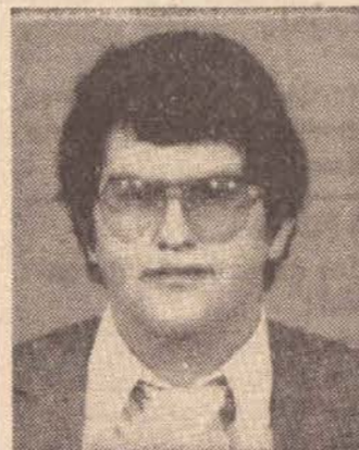
A ele, os nossos cumprimentos ao quadrado!

ano, veio a nossa cidade para providenciar transferência de documentação e aproveitou para matar a saudade dos amigos.