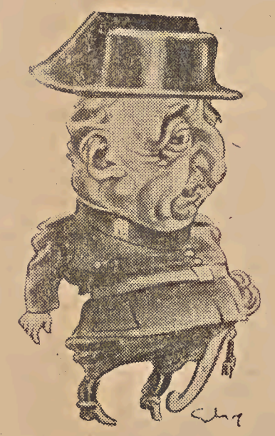
EL DETALLE DE LA SENTENCIA DE VITORIA

Carlistas y alfonsinos lograron la ayuda de Mussolini, con lo que pu-