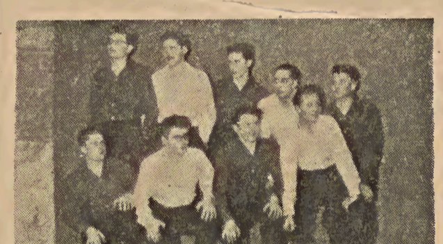
Les Piafs de la Chanson