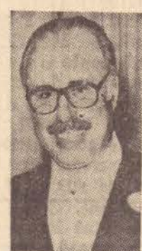
família iconística da Alta Sorocabana deseja um 1981 repleto de paz e harmonia", terminou.

DIÁRIO Oficial do Estado, publicando, na edição de 27 de dezembro, a Lei n.º 2.635, do Governo Paulo Salim Maluf, que estabelece novas percentagens para aplicação da quota parte da Taxa Rodoviária Única destinada ao Estado e aos Municípios. Da referida quota parte, segundo o Decreto em referência, fica para o Estado 37,5% e para o Município, 7,5%. O mesmo decreto revoga o de n.º 207, de março de 1970. O Município, sempre... dançando!