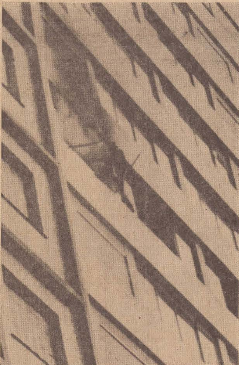
Em risco de propagação e perigo, o incêndio que destruiu um apartamento duplex do Imoplan, foi a ocorrência considerada de maior destaque pelos Bombeiros em 1980.

A 1.ª Seção de Combate a Incêndios, sediada em Presidente Prudente, atende cidades de toda região, e em toda natureza de eventos, e 1980 foi considerado no seu setor, um ano movimentado em número de ocorrências registradas.