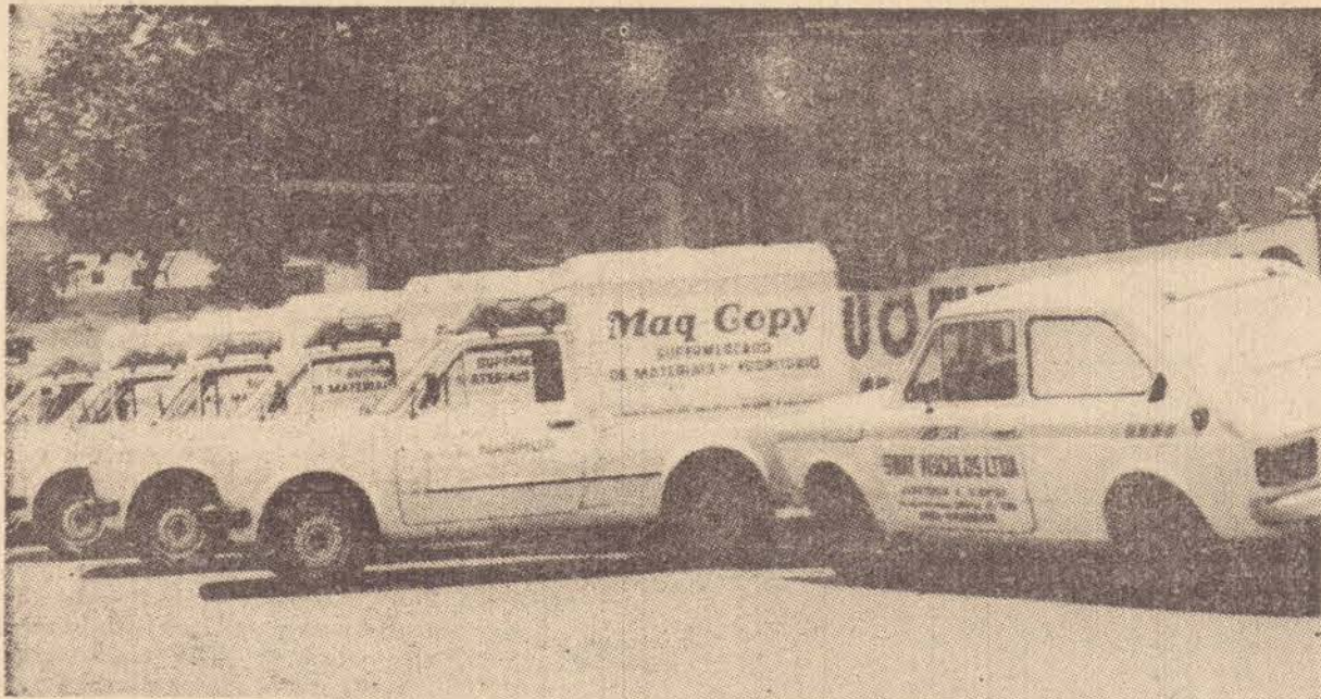
As cinco unidades Fiat Fiorino, entregues ontem pela Swat Veiculos a Maq-Copy.

Na manhã de ontem, a Swat Veiculos concessionária da Fiat Automoveis S.A., entregou em Presidente Prudente nada menos que cinco unidades Fiat Fiorino (à álcool) a outra empresa renomada: a Maq-Copy. Após o recebimento dessas unidades que passam a fazer parte de sua frota, a Maq-Copy, promoveu um desfile pelas ruas centrais da cidade, empolgando a todos que o assistiram.