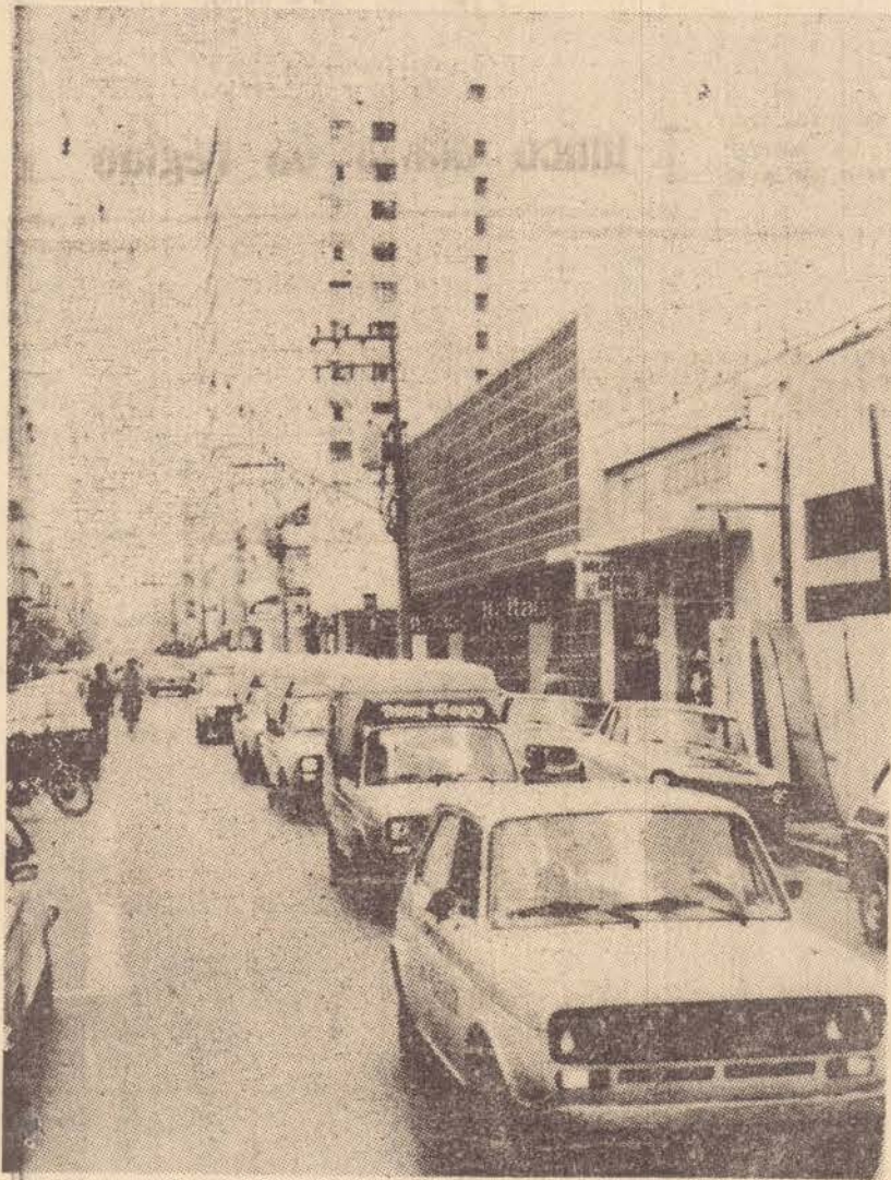
Pelas ruas centrais, o publico viu um espetaculo diferente: o desfile do Fiat Fiorino.