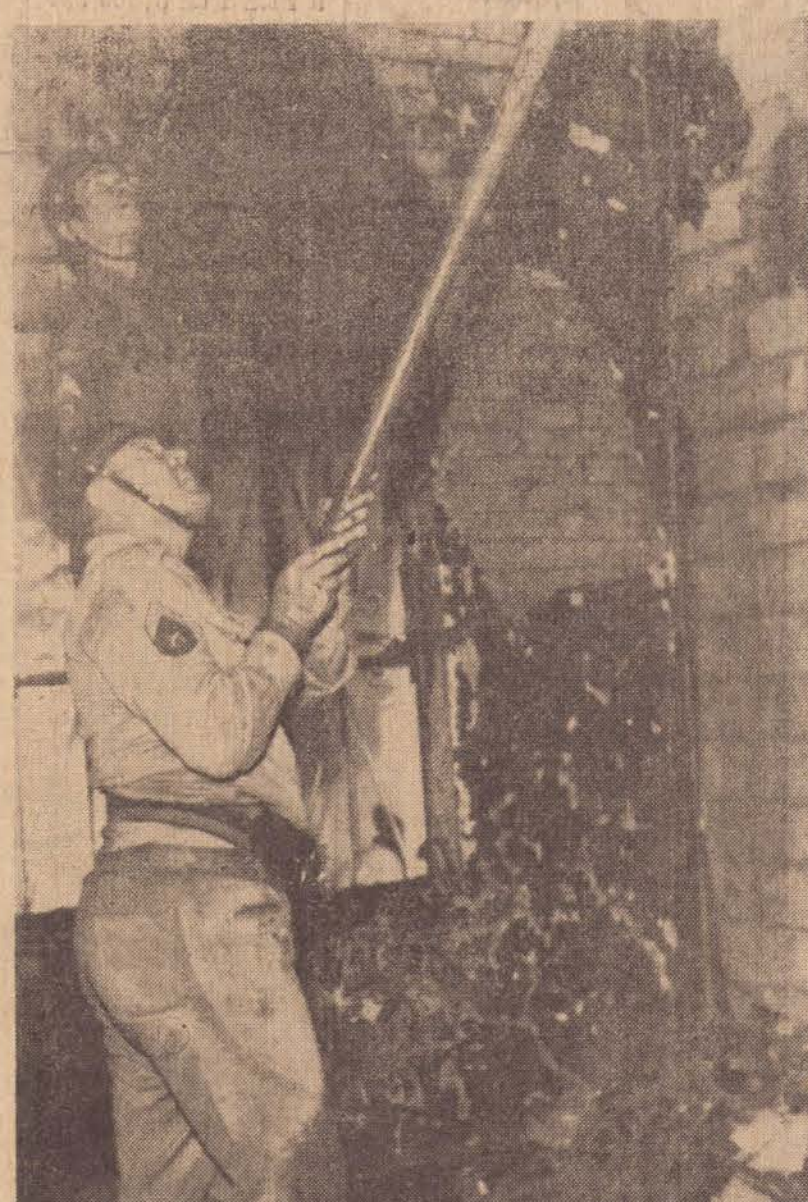
Durante o ano, o Corpo de Bombeiros local, atendeu 156 incêndios.

Nas épocas de estivação ocorridas durante o ano, foram frequentes os incêndios em ter-