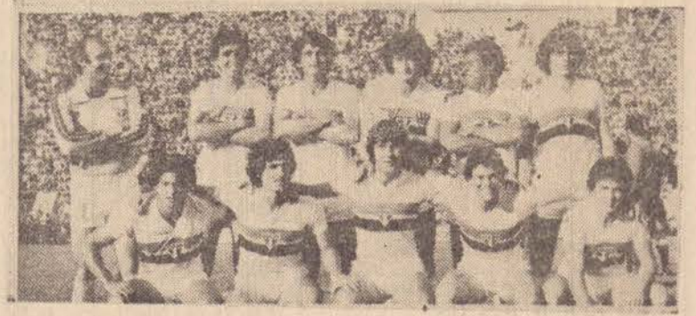
O esquadrão tricolor que hoje no Morumbi inicia a luta pelo bi-campeonato.