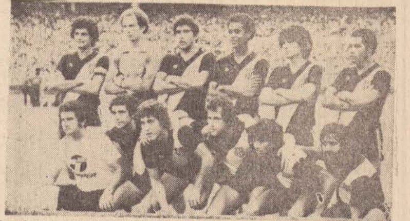
A valorosa equipe da Ponte Preta que vai tentar o seu primeiro título de campeão paulista.