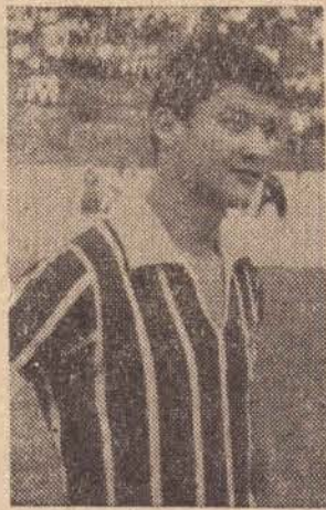
Segundo comentários que circulavam no último domín-