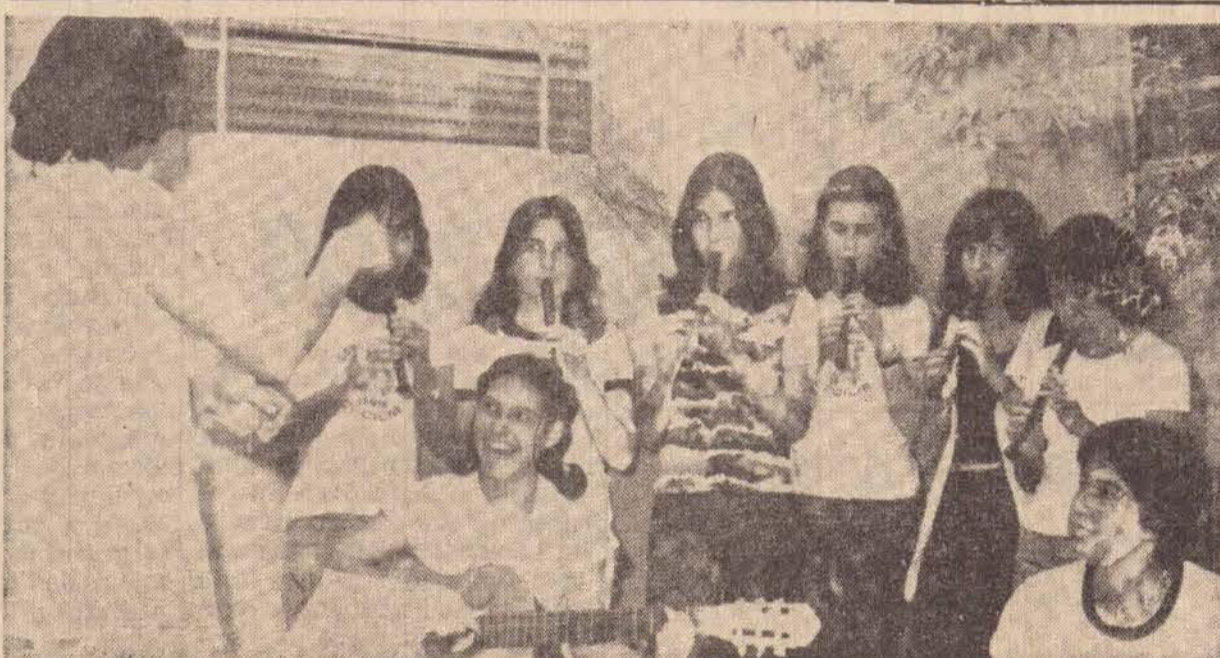
Jovens musicistas do Conservatório Santa Cecilia mantem ensaios diários

Antes de serem detidos, os malandrinhos que já contam diversas passagens pela policia local, haviam aplicado um golpe no valor de Cr$ 1.000,00 em cheque em outras casas comerciais de Assis. O nome ou iniciais dos detidos foi mantido em sigilo.