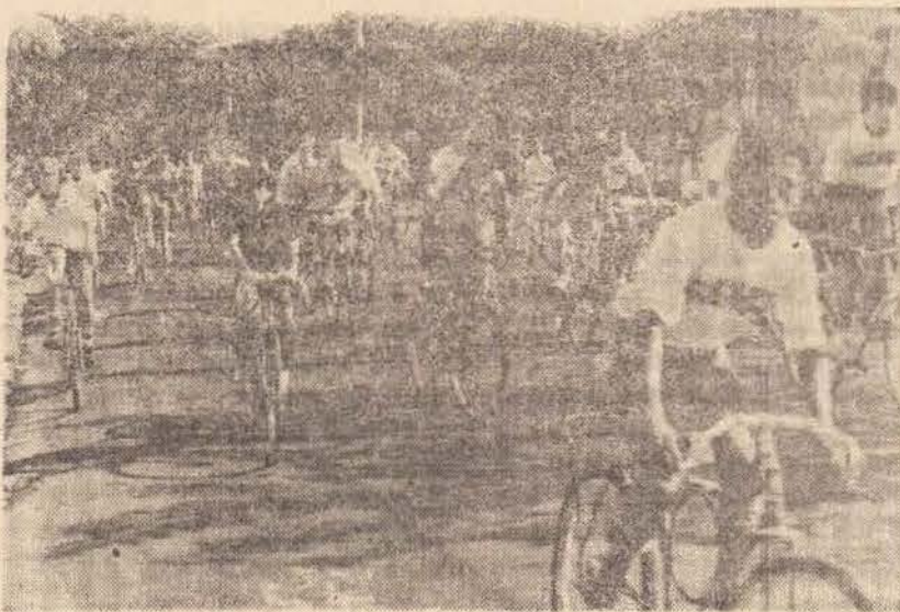
Aspecto do "Grande Passeio Prof. Ditão", realizado domingo.

A festa foi animada pelo conjunto Raízes do Samba, que em-