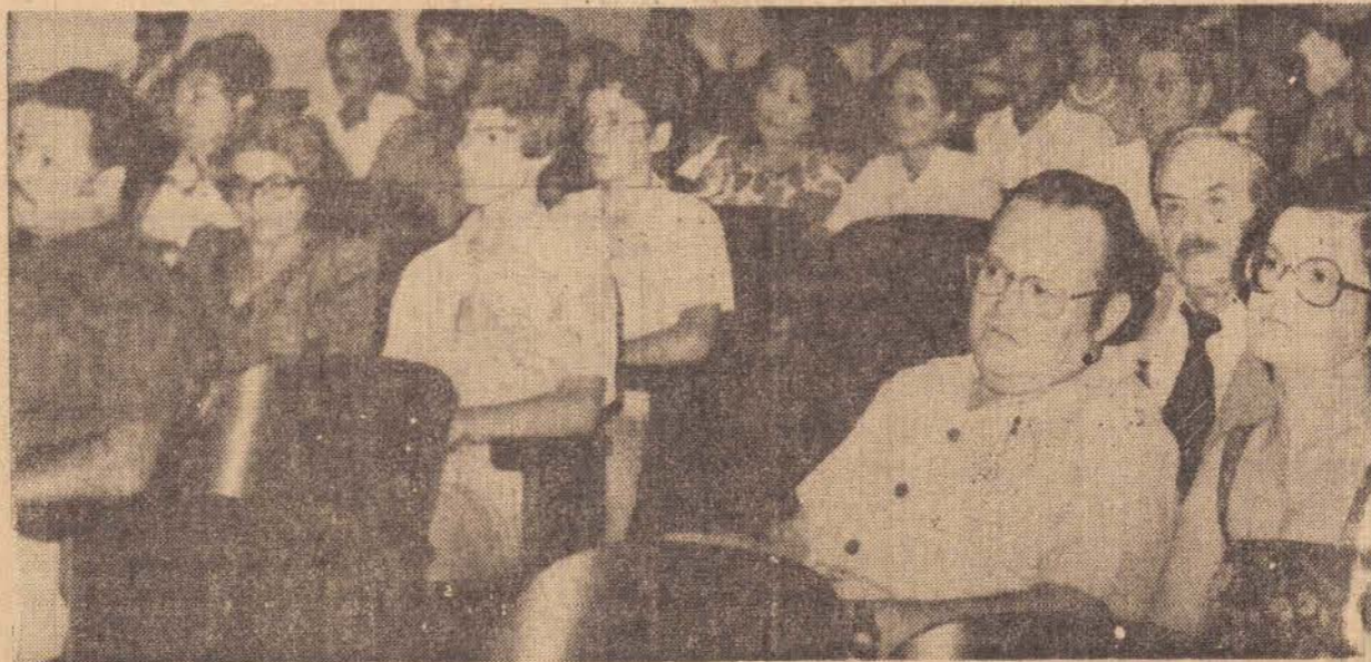
Grande publico compareceu prestigiando assim a solenidade.

Enquanto assim se procede só pode acontecer o que recentemente afirmou o Ministro da Educação, Eduardo Portela, o ensino do 1.º e 2.º graus estão em recesso.