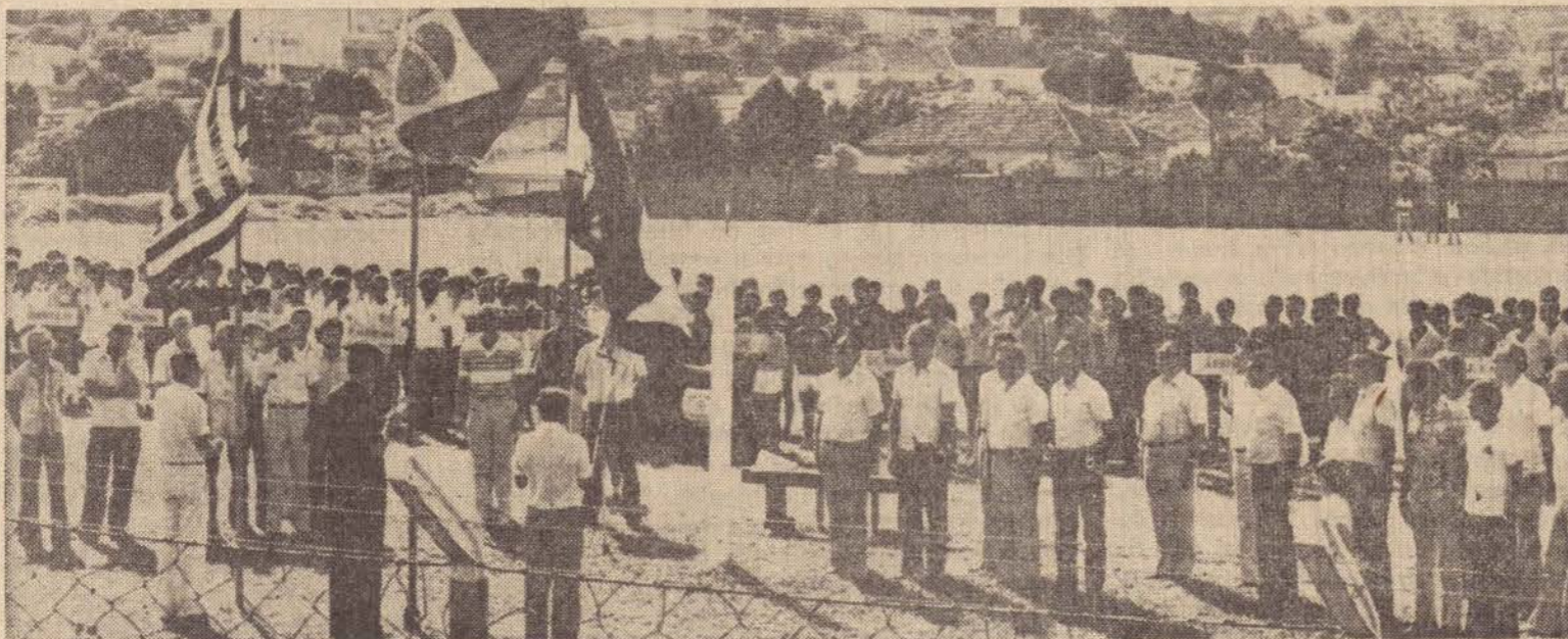
Momento em que estavam sendo hasteados os Pavilhões, Brasileiro, Paulista e do Município, com a presença das autoridades.

Mais uma vez, a exemplo do que aconteceu no ano passado, o Estádio Municipal, serviu de palco na manhã do último domingo, do Desfile de Abertura dos Campeonatos promovidos e dirigidos pela Autarquia Municipal de Esportes.