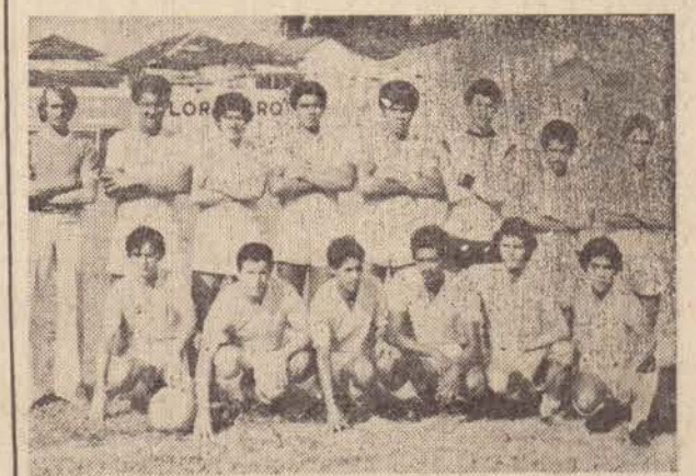
Equipe do Pop's F.C., que este ano participará do Campeonato Intersindical

A equipe do Pop's Futebol Clube fundada no ano passado, a 12 de outubro de 1980, vem se preparando com bastante intensidade para o próximo campeonato inter-sindical, que será realizado em nossa cidade nos próximos meses.