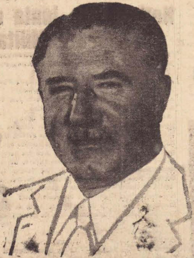
Governador Adhemar de Barros, estará recebendo no dia de hoje o Prefeito Luiz Ferraz de Sampaio