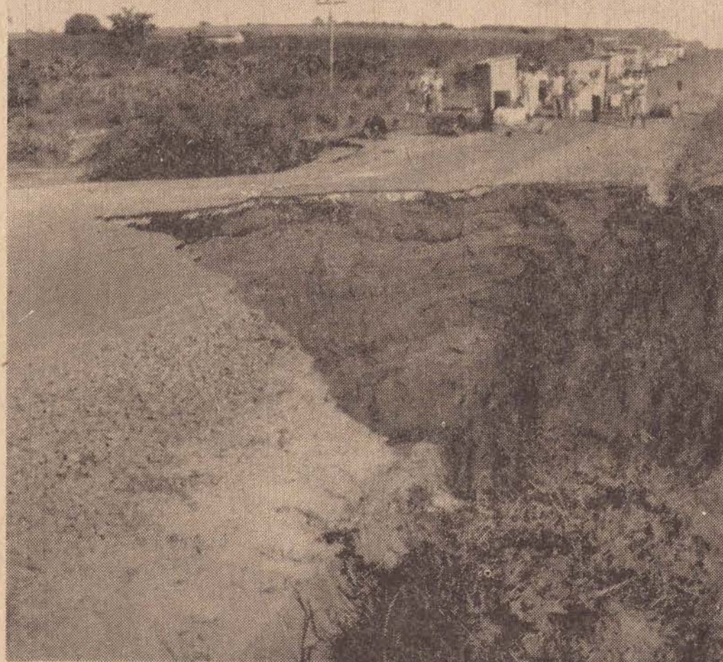
As águas das chuvas acumuladas à margem do asfalto roeram a tarde de ontem a pista da Rodovia Raposo Tavares no km 575. Turmas do D.E.R. já se encontravam alojadas para os trabalhos de recomposição do asfalto.

produção e apresentação de Pedro Pelosi.