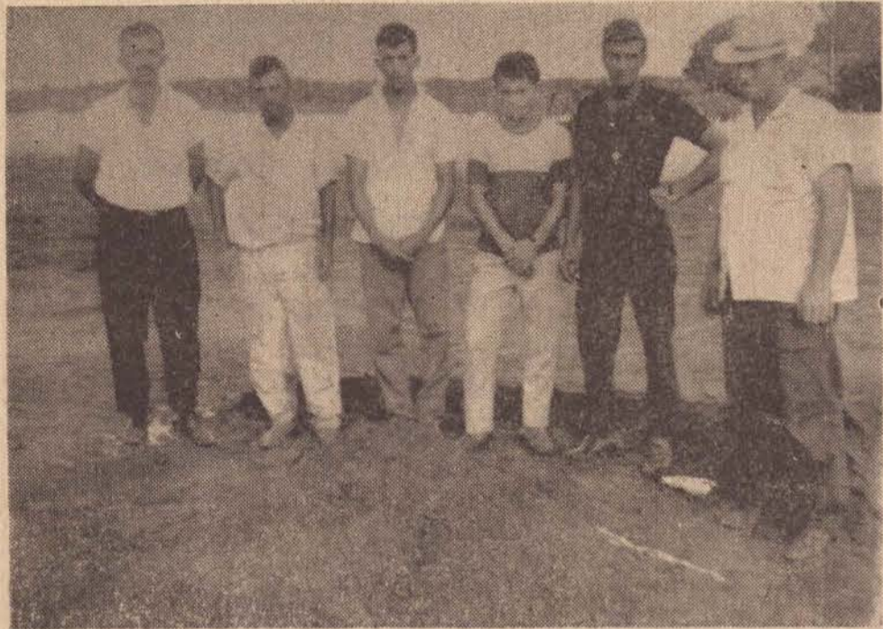
No cemitério de Alvares Machado as cenas verificadas foram de profunda tristeza e emoção. A pobre menina, cujo cadáver já estava em adiantado estado de decomposição foi enterrado numa sepultura simples. Morreu como vivêra: singelamente. Na fotografia o pai ao segundo da esquerda para a direita) e o irmão (o quarto na mesma direção)