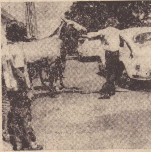
2 — Um popular puxou um a um para o centro da rua, afim de preservar o gramado da praça publica.