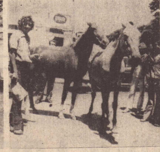
3 — Ei-los tranquilos, juntinhos. Mas alguma coisa está para acontecer com eles.