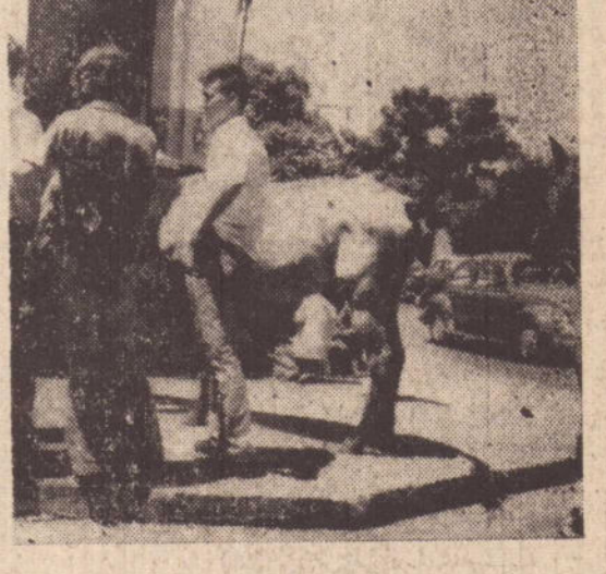
5 — Mas na rua o transito de veiculos incomodava e os cavalos vieram para as calçadas com menor perigo.