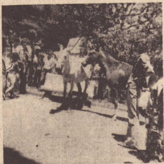
1 — Os dois cavalos apareceram na praça 9 de Julho e logo depois havia muita gente em torno deles.