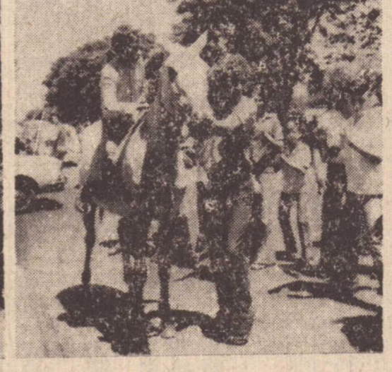
4 — O garoto aproveitou a presença dos equinos para um passeio sobre o lombo do animal, em pélo.