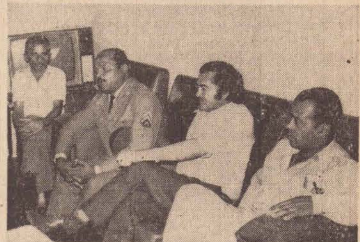
Na foto, os visitantes, em nossa redação.