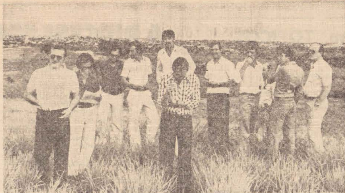
Uma das áreas visitadas, o Parque Bandeirantes, próximo a Colônia Mineira, poderá ser escolhida, dependendo dos estudos.

As autoridades monetárias sabem onde mexer e