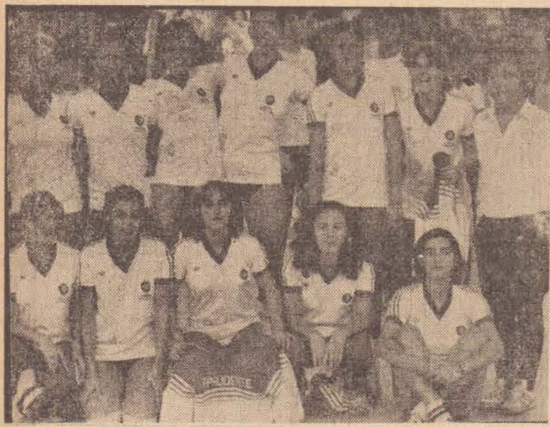
Equipe de Volei Feminino Adulto do Tenis Clube.

Nosso esporte amador volta a reviver na noite de hoje os grandes espetáculos esportivos, graças a participação de nossos clubes sociais nos campeonatos promovidos pela Federação Paulista de Basquetebol e Federação Paulista de Voleibol, com jogos que indiscutivelmente levarão grande público aos locais das competições, para torcerem por nossas cores.