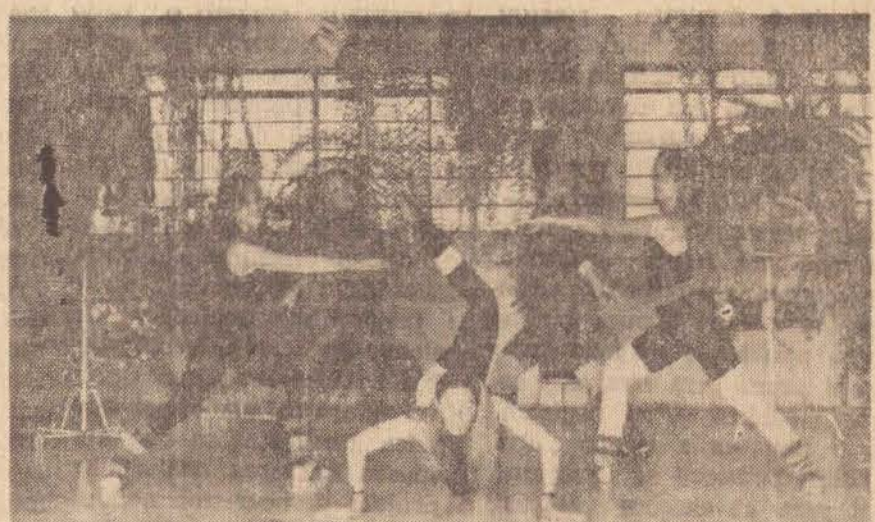
assim de aplaudir suas alunas que estão preparadas para grande exibição.

• Vai ser uma sensacional festa amanhã, no Parque do Povo pois a realização do Primeiro Festival de Pipas promoção do Jornal e Antarquia Municipal de Esportes Vai ser uma festa inesquecível, adultos e crianças empinando suas pipas.