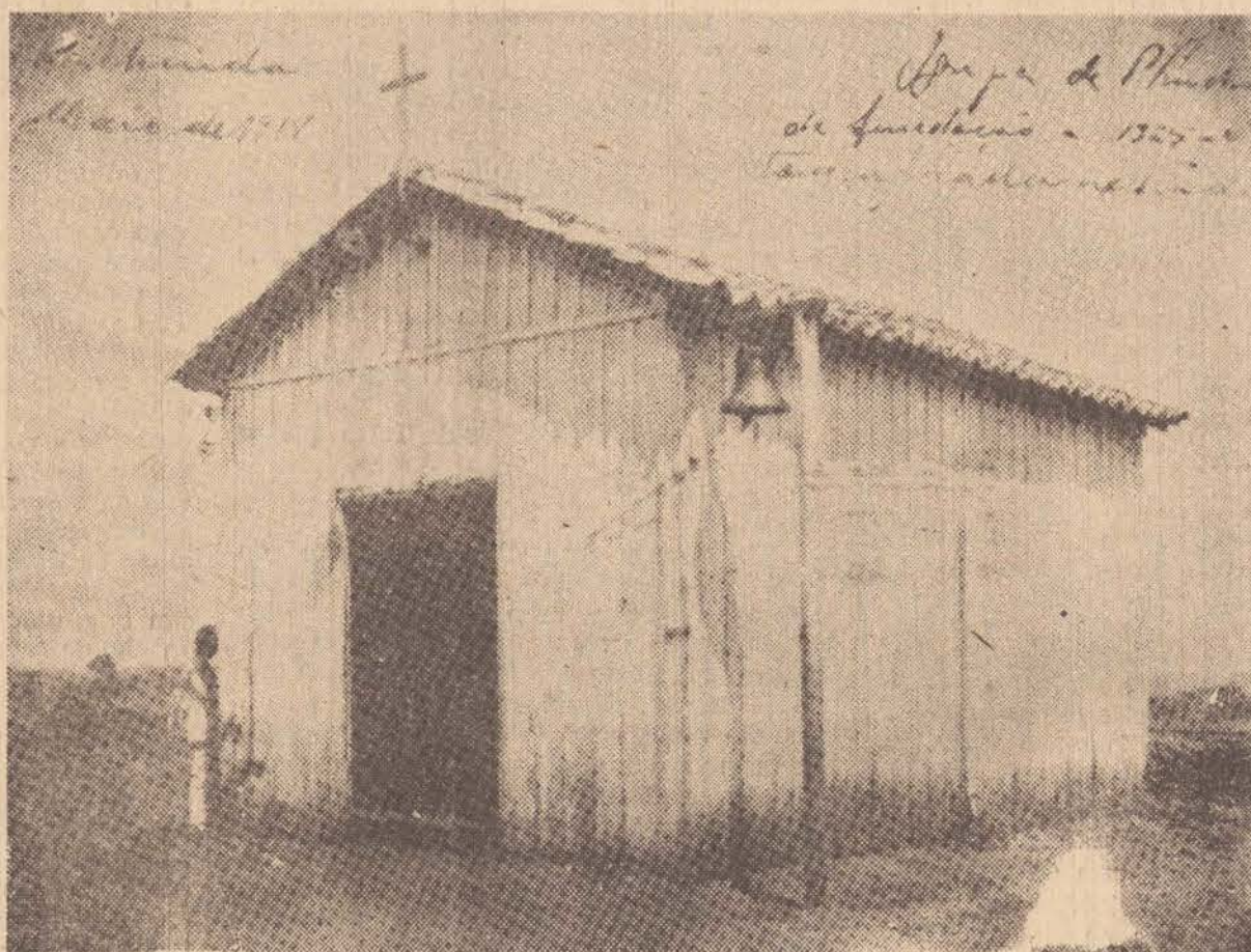
Esta foto, que mostra a primeira capela da cidade é uma das ilustrações da exposição de hoje no calçadão