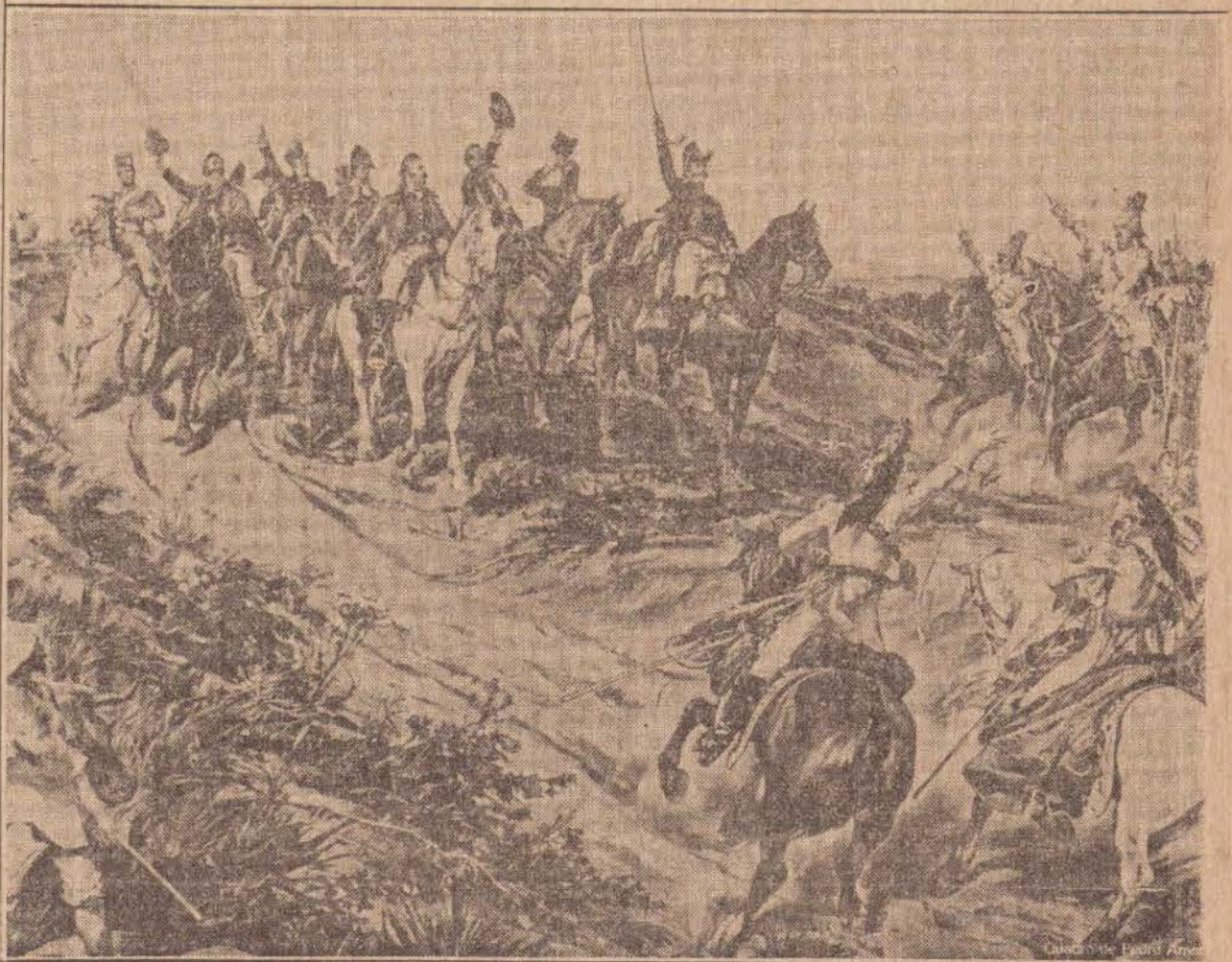
Participação da Sabesp no 157º aniversário da nossa Independência.

Há momentos na História em que o grito de um homem é o grito de um povo.