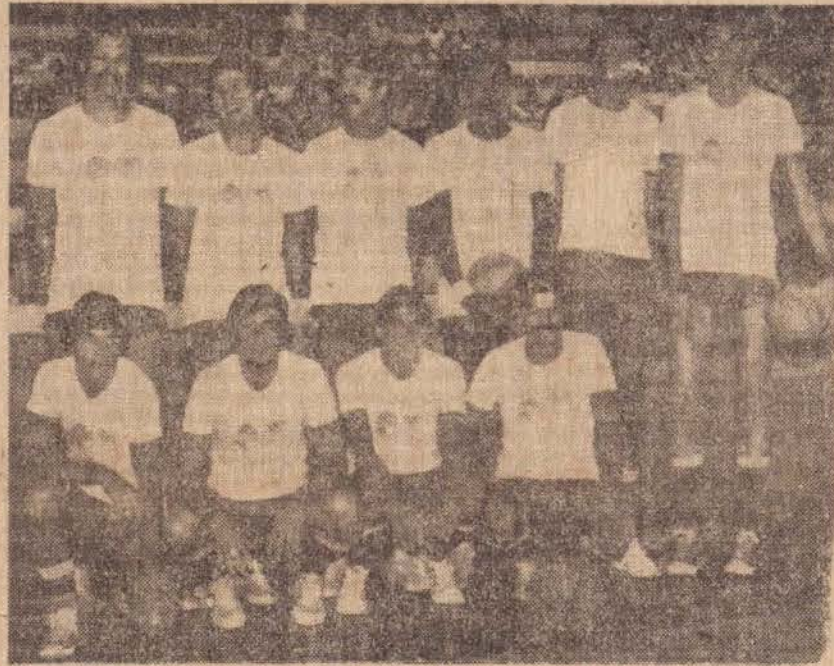
Equipe do Clube das Bandeiras de Osvaldo Cruz que logo mais enfrentará a equipe do Sogipa de Porto Alegre.