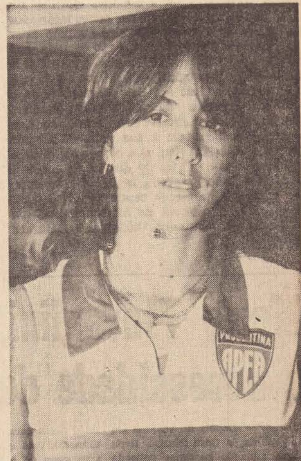
A atleta da seleção brasileira, contratada pela Prudentina.

Para finalizar perguntamos se só falta a seleção brasileira de futebol vir no Prudente e respondeu dizendo que tem certeza quando o estádio estiver pronto, um clube de Prudente vai disputar o campeonato brasileiro.