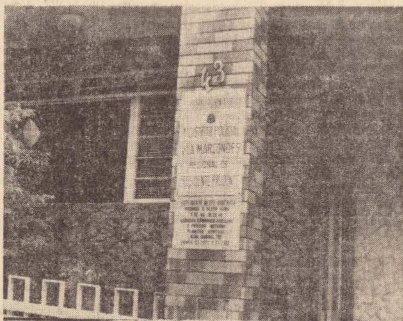
O 1.º DP, na Vila Marcôndes

O 1.º Distrito Policial funciona das 8 às 18 horas, permanecendo fechado durante a noite e a madrugada, com a vigilância de um Guarda Noturno que cuida do quartelão. Num descuido do guarda, ocorreu o furto. Alguns menores foram vistos se evadindo do local e um deles até reconhecido.