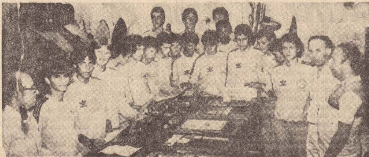
Flagrante colhido da visita da delegação do Guarani F.C. ao Jornal O Imparcial.

Com uma equipe especialmente selecionada, dentro da idade limite de 16 anos, para as disputas do 1.º Campeonato Estadual Dentão, a equipe do Guarani F.C. da cidade de Campinas, vem realizando excelente campanha dentro da competição, estando classificada para a segunda fase do certame que terá início no dia de hoje.