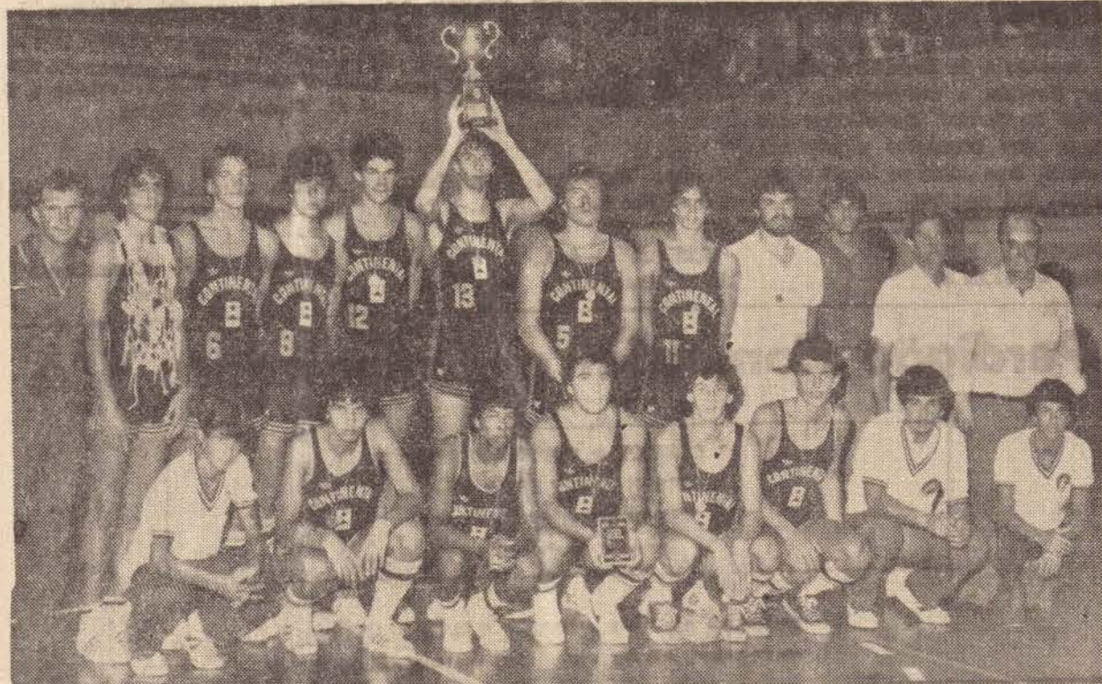
Equipe do Continental Parque Clube, campeã estadual Infante Juvenil