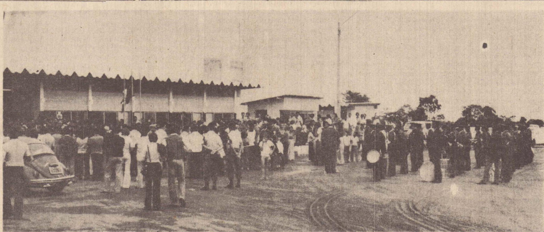
Muita gente presenciou ontem a inauguração do novo posto fiscal em Porto XV de Novembro, (MT)