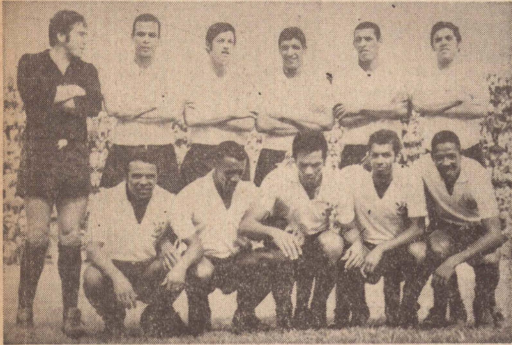
Esta é a equipe do Corinthians que derrotou domingo ultimo o Corinthians local pelo contagem de 5 a 0.