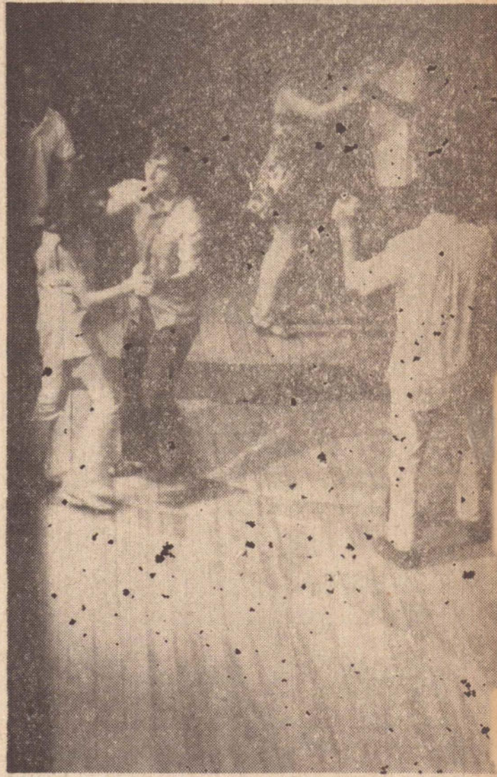
Valsear também pode dar pontos, e por isso eles estão praticando dia e noite. Quanto aos outros, ao invés de dançar, mandem livros.