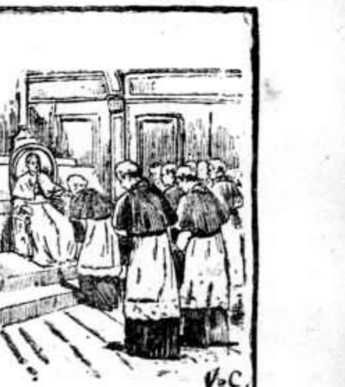
A primeira obediencia dos cardeses

Além dos seus conhecimentos scientificos, é tido como muito versado em Bellas Artes, sendo tambem regente de musica liturgica. E' grande conhecedor de quadros e teve sobretudo estudos sobre a escola veneziana. Tal é, em largos traços, a physionomia do novo Papa, cuja escola parece demonstrar mais uma vez a sobrenaturalidade das inspirações do Sacro Collegio.