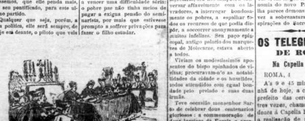
... o officio de...

Reportando-nos ás palavras da nossa informante, que nos merece todo o credito, fulguramos publicar particularidades inteiramente desconhecidas e que certamente muito prazer irão causar ao publico, ansioso por conhecer alguma cousa da vida do illustre principe elevado ao solio pontificio.