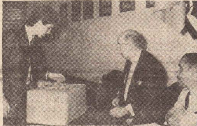
Cada proposta foi representada por inúmeros volumes, que durante 60 dias serão examinados minuciosamente, até a proclamação final dos resultados.