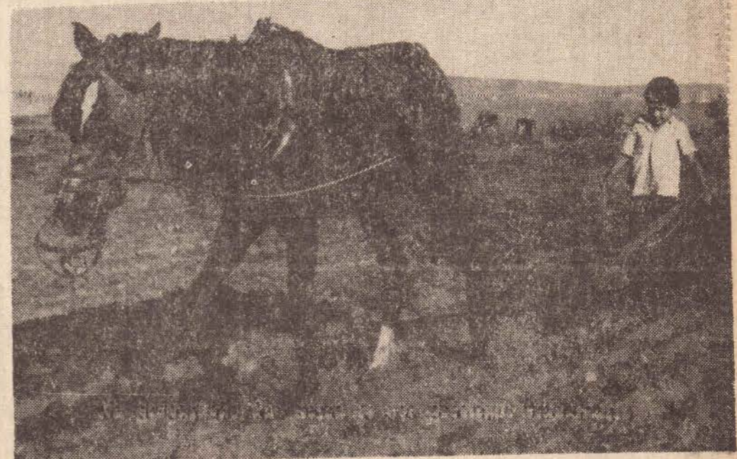
Na preparação da terra to dos precisam trabalhar

Um adventista procurou esta semana a Casa de Agricultura par pedir orientação técnica, pois pretende plantar 400 alqueires de colônias com adubo. Outro, para surpresa dos técnicos pretende adubar campo de pangola. "Toda campanha que desenvolvemos junto aos lavradores para que utilizem fertilizantes tem alcançado resultados pouco animadores e agora se aduba o plantio de capim, disse o eng. Toselo.