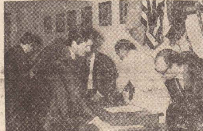
A S.A. Philips do Brasil foi a primeira empresa a se habilitar à concorrência do Plano Diretor de Expansão da Telefonia na Alta Sorocabana