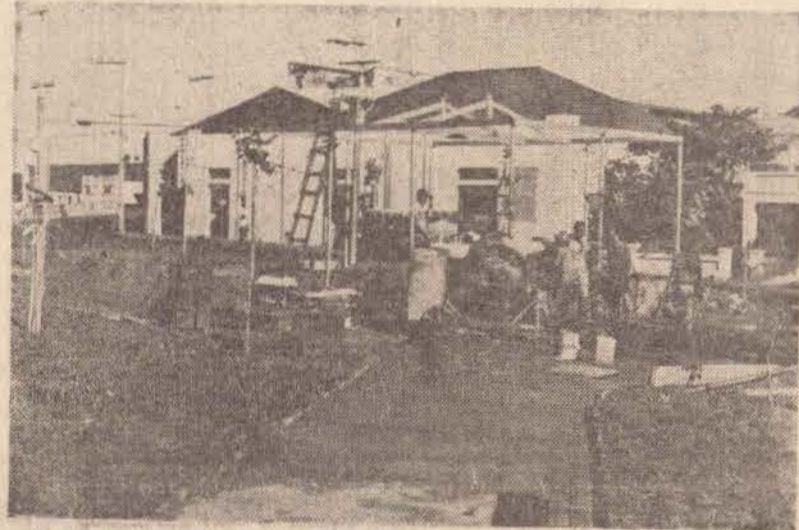
A nova praça terá também um coreto ao estilo seresta.

Este será o segundo grande reajuste das taxas cobradas pelo BNCC, que em janeiro, do ano passado passou de 18 para 43,2 por cento; medida que provocou segundo o presidente da instituição grande protesto principalmente no nordeste. O novo reajuste, segundo Shibuya, será melhor absorvido pelos agricultores, não apenas porque ainda estão muito distantes das taxas cobradas no mercado mas principalmente porque o BNCC precisa ajustar ligeiramente suas taxas para enfrentar a expansão dos serviços e ampliar a sua área de ação.