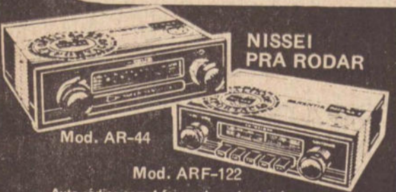
Mod. AR-44 Mod. ARF-122 Auto rádios com 4 faixas de onda de alcance mundial. Sintonia manual ou automática. FM/AM/49/31/25 ms. Potência de 5 watts, sem distorção e isento de ruídos e interferência. Totalmente transistorizado.