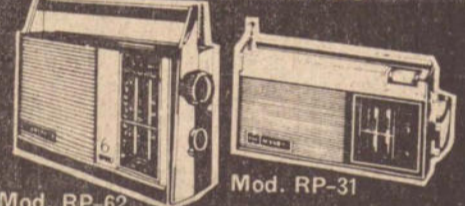
Mod. RP-62 Radios portáteis com 2,3 e 6 faixas de onda, inclusive com frequência Modulada. Modelos compactos e em cores atraentes. Funciona com pilhas comuns. Alcance mundial. Auto falantes especiais.