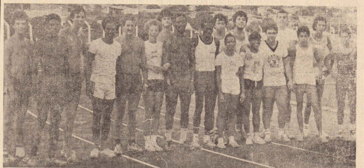
Equipe de atletismo Ipanema/Amepp que se encontra em treinamentos