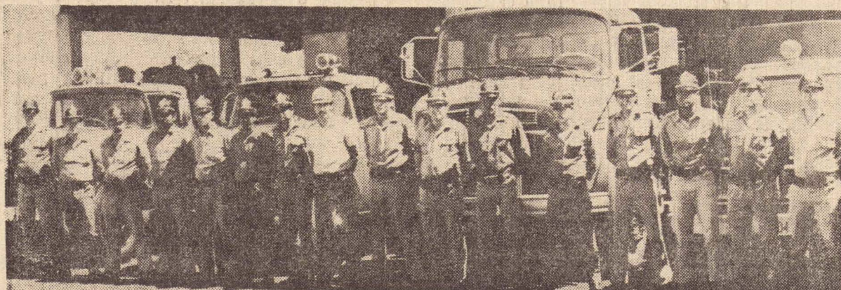
Os nossos valorosos bombeiros

E' extremamente necessária a aquisição de uma auto-escada Maggirus, para os salvamentos e o combate de incêndios em altura, já que P. Prudente tem vários prédios acima de 10 andares. O deputado Antonio Zacharias, se manifestou a respeito; pedindo a doação deste equipamento ao Governador, porém até agora não teve nenhuma resposta.