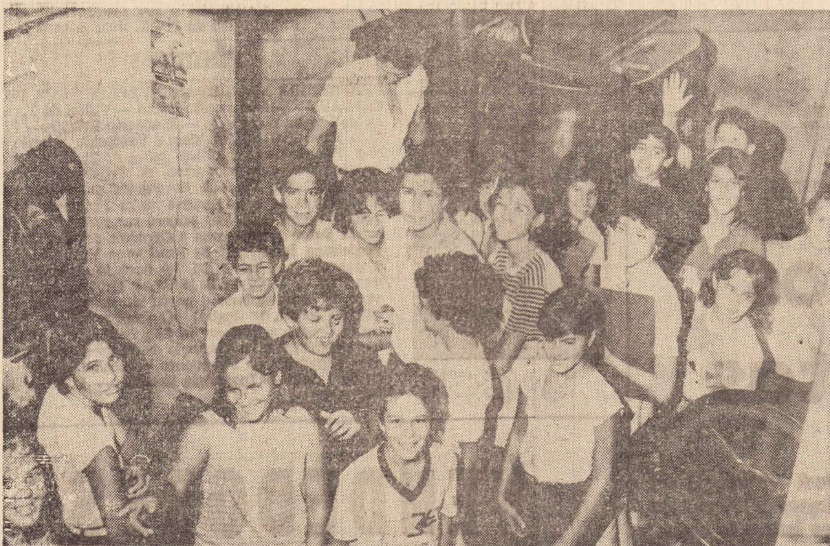
Na foto, um flagrante da visita feita ao jornal "O Imparcial" pelos alunos de 1.º grau do colégio Joaquim Murtinho. Os pe-

quenos, satisfizeram sua curiosidade, conhecendo todas as etapas do funcionamento do jornal, da redação às oficinas.