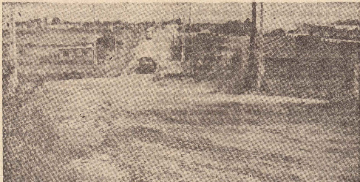
Caminhões enfrentam dificuldades para ter acesso à Indústria J.B. Duarte em Santo Anastácio pela rua 15 de Novembro. A indústria pede a pavimentação da via pública.