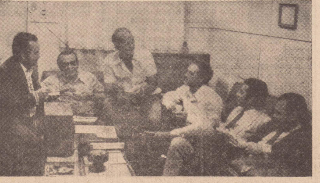
Na foto, os diretores do novo clube, juntamente com os concessionários locais em conversa com um dos nossos redatores.