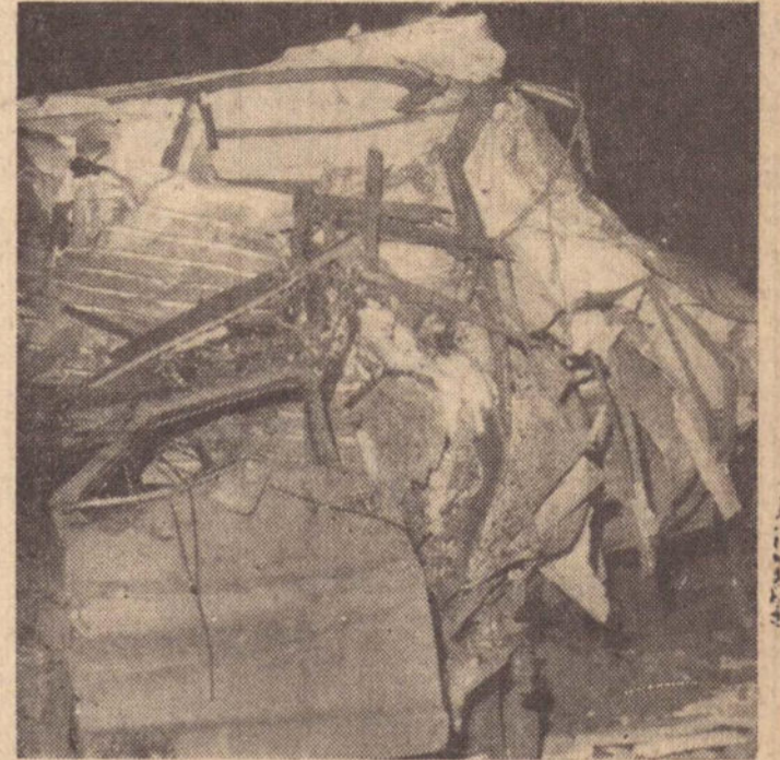
Do caminhão-frigorífico, restou apenas um monte de ferros retorcidos.

motorista, Ari Quilate, que recebeu graves ferimentos na cabeça e teve quatro costelas quebradas.