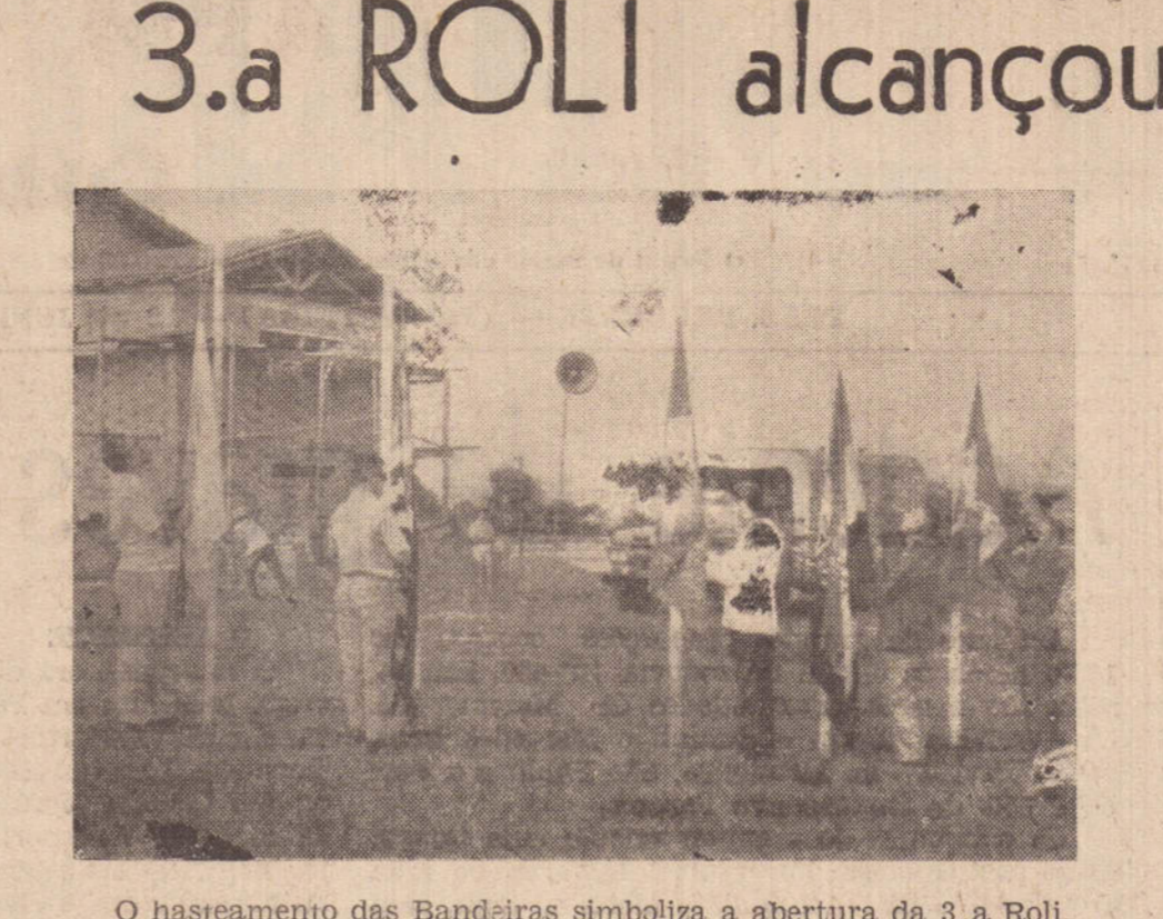
O hasteamento das Bandeiras simboliza a abertura da 3.ª Roli.