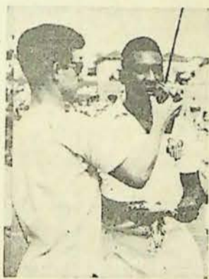
Nesta foto o jogador Pelé no auge do Santos FC, no gramado da Associação Prudentina de Esportes Atléticoes, falando a uma emissora da cidade.

RIO — Tres anos depois Pelé voltará ao Maracanã como a principal atração de um jogo beneficente. A ultima vez no final de 76, quando ele vestiu a camisa da seleção brasileira, num jogo contra o Flamengo, quando a renda reverteu a família de Geraldo, morto na mesa de operações quando se submetia a extração das amígdalas. No dia 6 de abril Pelé estará em campo com a camisa do Flamengo, durante o primeiro tempo, para enfrentar o Atletico, Mineiro em jogo cuja renda será destinada aos flagelados e desabrigados das enchentes do Rio São Francisco.