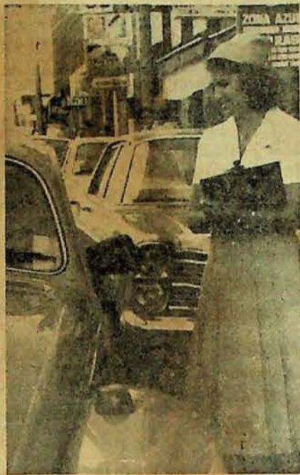
Apesar de anunciada há muito tempo, o primeiro dia da "zona azul" causou surpresa a muitos motoristas.

No primeiro dia da implantação da "zona azul" na rua Barão do Rio Branco, ontem, os motoristas reagiram de variadas formas. Uns protestaram contra o pagamento de Cr$ 5,00 por duas horas de estacionamento; outros elogiaram a iniciativa.