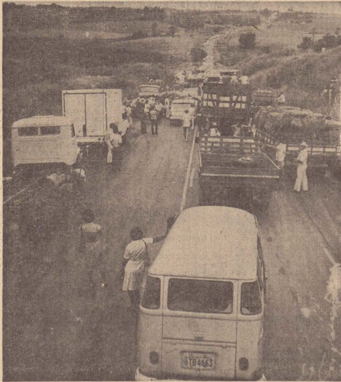
A tríplice colisão, provocou paralisação de 3 horas no trânsito da SP-425, com fila de quase 4 quilômetros.

Outra importante transação do futebol paulista foi concretizada ontem, quando o São Paulo contratou o atacante Careca, do Guarani, pagando Cr$ 150 milhões e cedendo três jogadores ao clube campineiro: — Everton, Luis Muller e Savio. Os detalhes sobre a compra de Batista pelo Palmeiras e de Careca pelo São Paulo, além do noticiário esportivo geral, estão na última página.