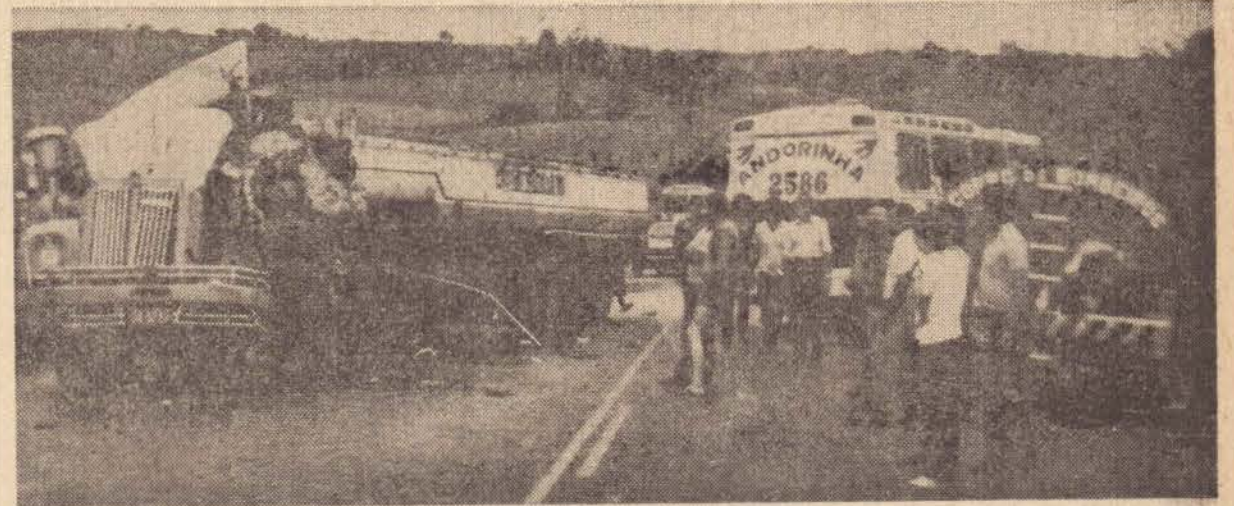
O motorista do Passat nada sofreu, mas os motoristas da carreta e do ônibus ficaram em estado grave

As vítimas, foram os motoristas da carreta e do ônibus, e 11 passageiros do coletivo, todos socorridos por popu-