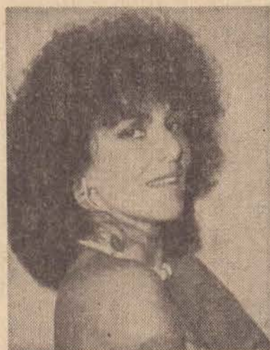
Irene Ravache, melhor atriz de 82