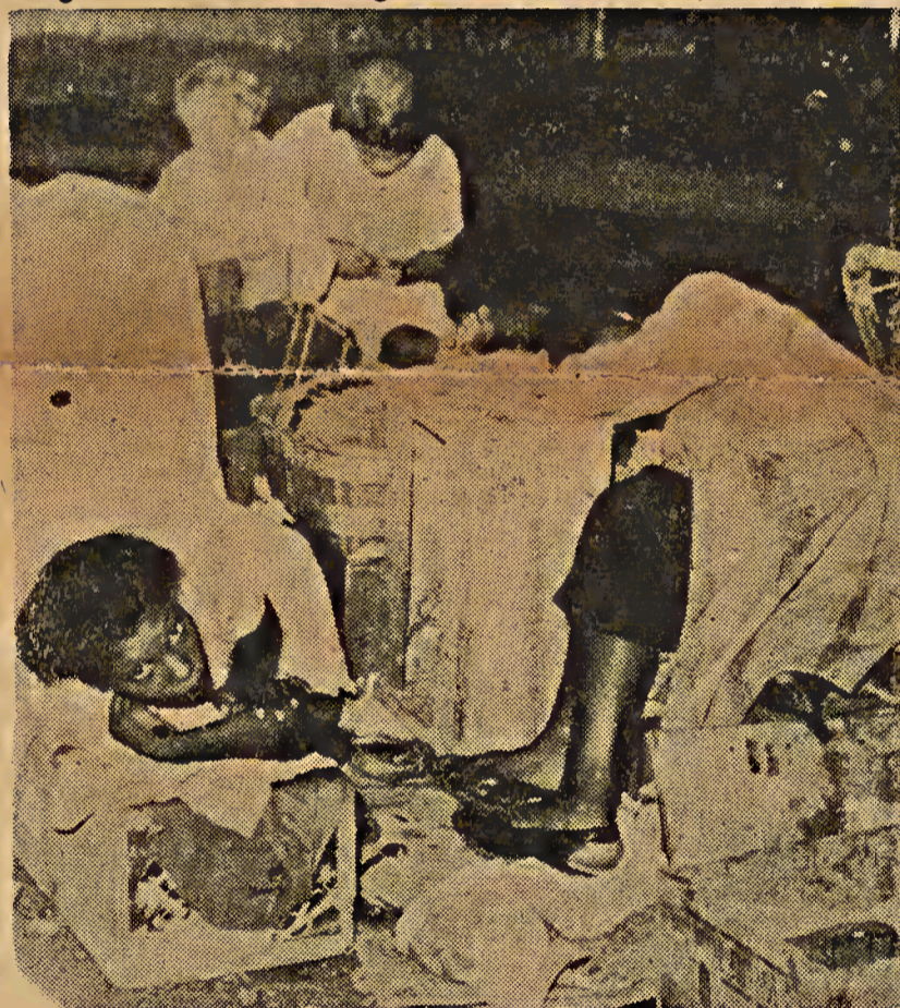
Cênas como esta, de pavorosa miséria, são comuns nas casas proletárias. Isto são coisas que não interessam aos magnatas reunidos no luxuoso Hotel Quitandinha, na conferência de Petrópolis...