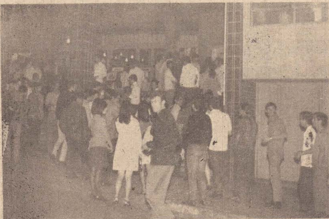
O flagrante acima foi tomado à entrada do Cine Presidente, momentos antes da exibição de "O VALE DAS BONECAS". Esta película permanecerá em cartaz ainda hoje e amanhã em nossa cidade.

A Empresa Teatral Pedutti, com o lançamento do filme "O VALE DAS BONECAS", ontem, iniciou o sistema de lançamentos simultâneos — Capital e Presidente Prudente.