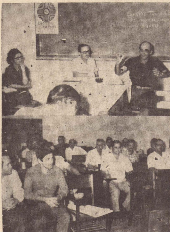
No plano superior, a mesa que presidiu os trabalhos e abaixo, os empresários e demais participantes da reunião de ontem.