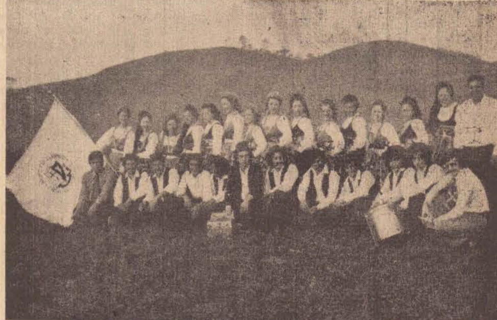
O grupo folclórico "Casa de Portugal" que estará em nossa cidade, nos dias 20 e 21 de março.

No sábado, a partir das 20 horas, será cobrado apenas ingresso de entrada e do que a pessoa consumir pagando no ato — Aperitivo sendo os petiscos — sardinhas na brasa, bolinhos de bacalhau, tremoços, vinhos e haverá também refrigerantes e a cerveja. Os canecos serão vendidos no local. Todos ficarão a vontade podendo sentar-se as mesas que são livres.