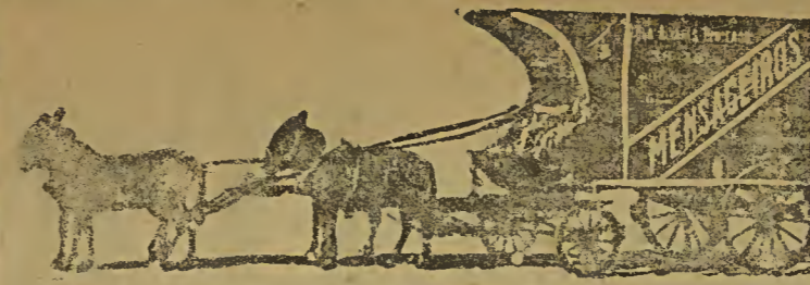
Transport und Verschiffung von Fracht- und Eilgut.

Elektrische Anlagen in den Distrikten von Villa Americana, Nova Odessa, Rebouças, Cosmopolis und Santa Barbara. Lieferung von elektr. Kraft zu günstigen Bedingungen für kleine und grosse Industrien. Elektr. Motore und alles nötige Material stets auf Lager.