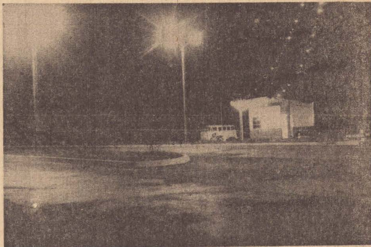
Uma vista noturna do Posto da Patrulha Rodoviária Federal no Porto XV.

Baseado em jurisprudência do Supremo Tribunal Federal, o TST, no mesmo julgamento, excluiu do dissídio os professores e auxiliares da administração escolar das prefeituras de São Paulo, Campinas e Sorocaba. No entender do STF, esse não é o meio le-