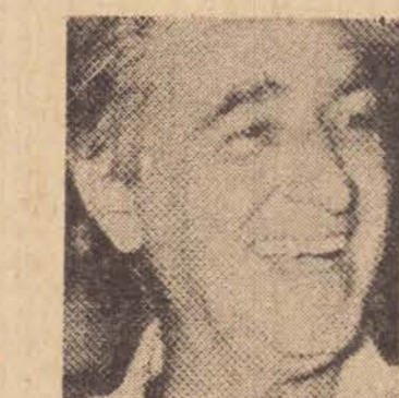
O senador Franco Montoro, do PMDB, explicou ontem o retorno de parlamentares e políticos aos quadros do sucedâneo do MDB dizendo o que se verifica é uma tomada de consciência dessas pessoas responsáveis que sentiram ser preciso unir as oposições e, conseqüentemente evitar a divisão, que seria desastrosa.

“Eu tenho certeza de que as eleições deste ano serão realizadas”. Com essa expectativa, o presidente nacional do PMDB, Ulysses Guimarães iniciou ontem incursão de três dias à região de Ribeirão Preto, para manter contatos destinados a orientar na formação de comissões provisórias do partido. Este também será o objetivo de um cronograma regressivo que o partido vai elaborar, tomando por base a data de 15 de agosto quando deverão estar registrados os candidatos às eleições municipais e já ter sido realizada a convenção nacional para registro definitivo do PMDB.